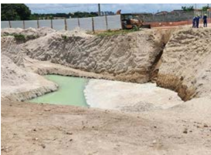
Contaminação mudou cor da água de azul turquesa para verde

Nesta terça-feira (14), a prefeitura publicou nota onde explica que levou em consideração a po-