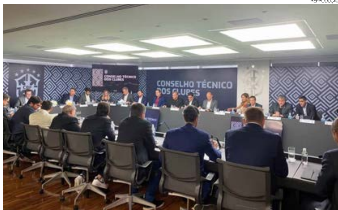
Dirigentes se reuniram na sede da CBF para debater sobre racismo, rebaixamento e atletas estrangeiros

ta de R$ 500 mil. Em caso de reincidência, o clube perderá mando de campo. Sobre os jogadores estrangeiros, a proposta é de aumentar a utilização de cinco para sete atletas por partida, mas ainda não está definido, assim como o número de rebaixados.