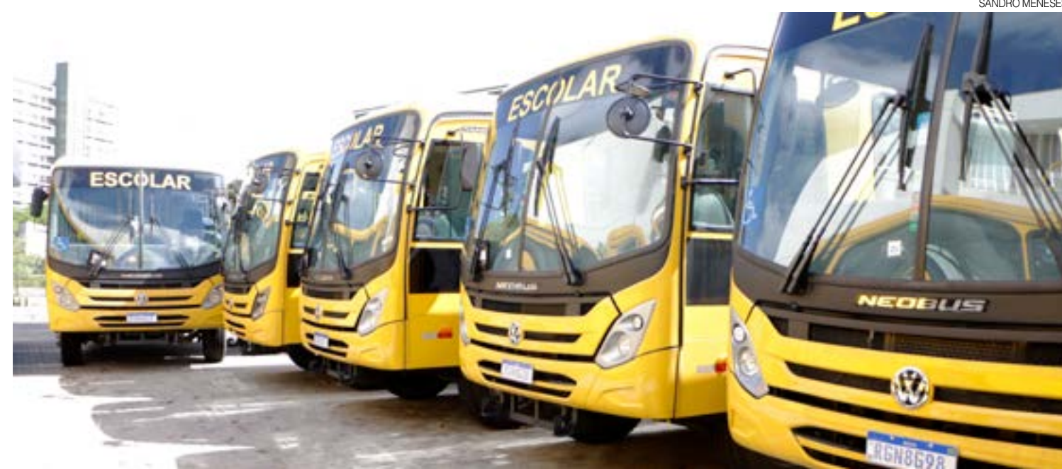
A SEEC adquiriu 86 novos ônibus escolares para fortalecer as linhas e rotas administradas pelas prefeituras em colaboração com o estado