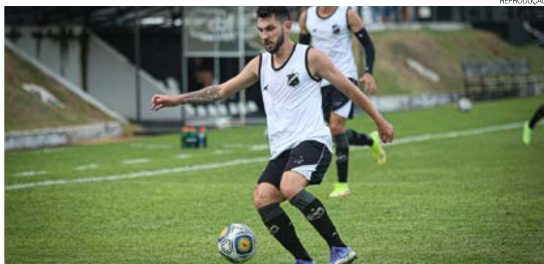
Mesmo jogando diante da Frasqueira, time alvinegro terá um jogo difícil contra equipe do Maranhão