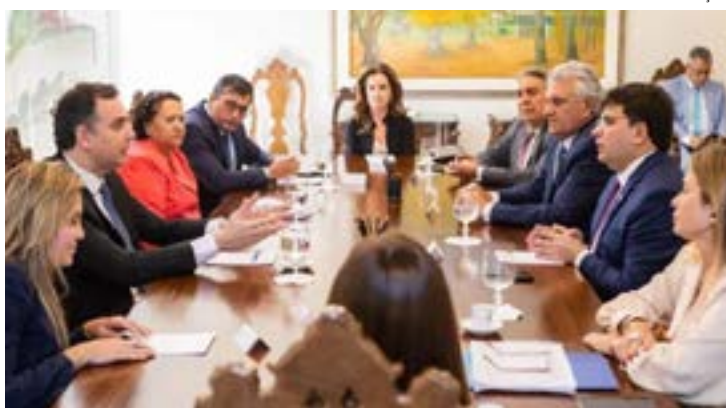
Governadores se reuniram com presidente do Senado, Rodrigo Pacheco

nando Haddad avançou com a proposta, tratamos com o poder Judiciário e agora a participação fundamental do Legislativo - Senado e Câmara dos Deputados. Este entendimento com todas as partes federativas é imprescindível para