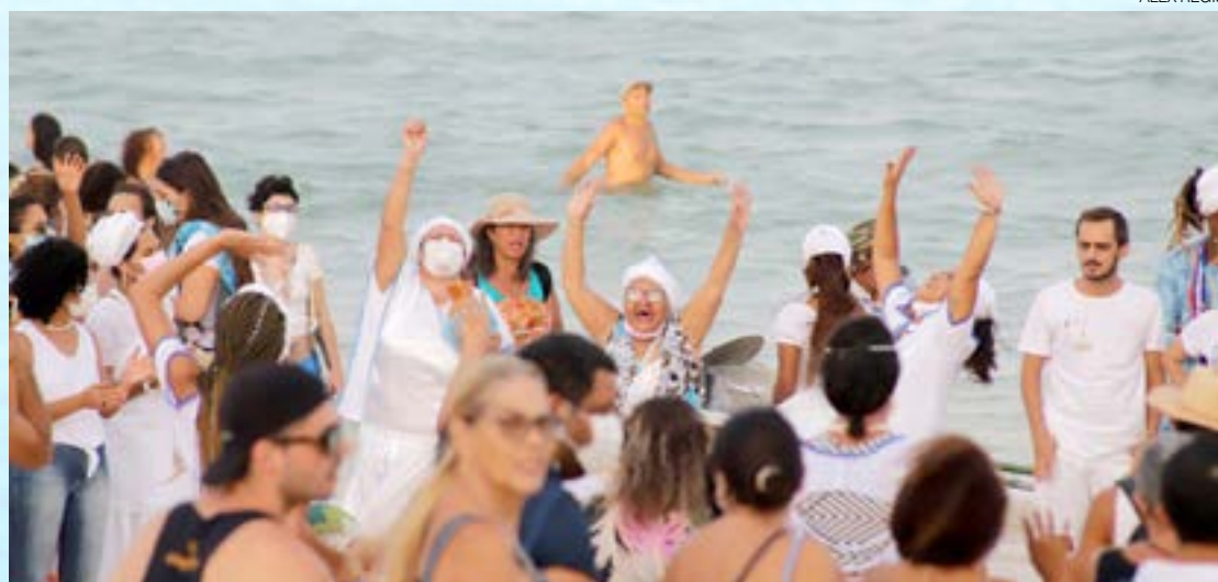
Celebração em torno de Iemanjá reúne gerações num momento de religiosidade das matrizes africanas

dos festejos. "Para o povo de axé, celebrar a rainha do mar tem um significado único, ela representa a vida, a mãe de todas as cabeças, guia para todos os filhos de santo. A importância da realização de um evento de grande porte para essa celebração é dar visibilidade para a cultura afro religiosa da nossa cidade".