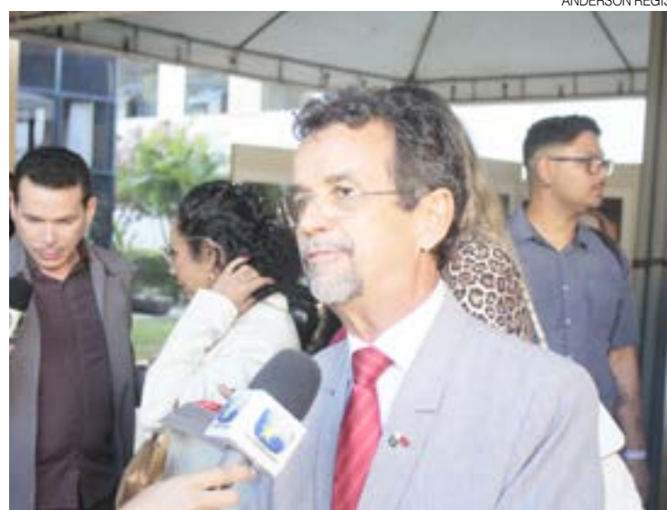
Fernando Mineiro (PT), já foi vereador e deputado estadual

Terceiro mais votado no RN, Benes Leocádio (União Brasil), comemorou a posse de segundo mandato federal e agradeceu aos quase 100,7 mil potiguares que o reelegeram. "Assumo com muita honra, orgulho e gratidão o mandato que o povo do Rio Grande do Norte me concedeu, convic-