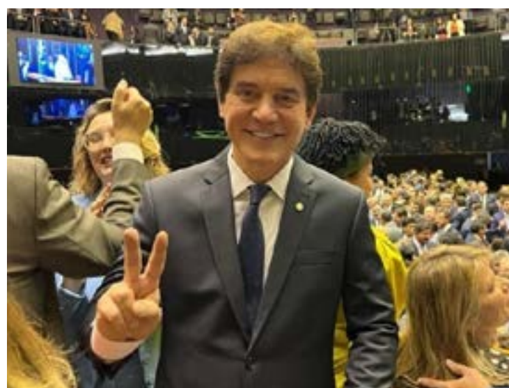
Robinson Faria (PL), foi 4 vezes presidente da Assembleia e governador do RN

to dos desafios e dos compromissos assumidos por nosso Estado. Obrigado ao povo potiguar pela confiança. Pela frente, muito mais trabalho pelo RN! Vamos à luta!", disse.