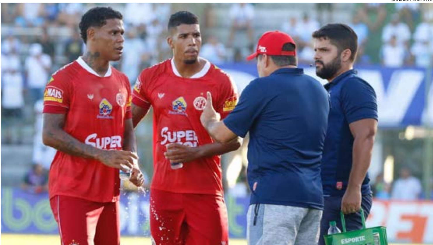
Time alvirrubro vai enfrentar hoje o Potyguar de Currais Novos, às 15h, no estádio José Vasconcelos da Rocha, em Parnamirim

Vale lembrar que na estreia do estadual de 2022, o América perdeu para o Potyguar de Currais Novos por 3 a 2, fora de casa. O árbitro da partida de hoje será Leonilson Fernandes Trigueiro Filho, auxiliado por George Ítalo e Reinaldo de Souza. A rodada de abertura desta quarta-feira ainda terá Santa Cruz x Potiguar de Mossoró, às 15h, no Frasqueirão, e Globo x Alecrim, às 15h, no Barretão.