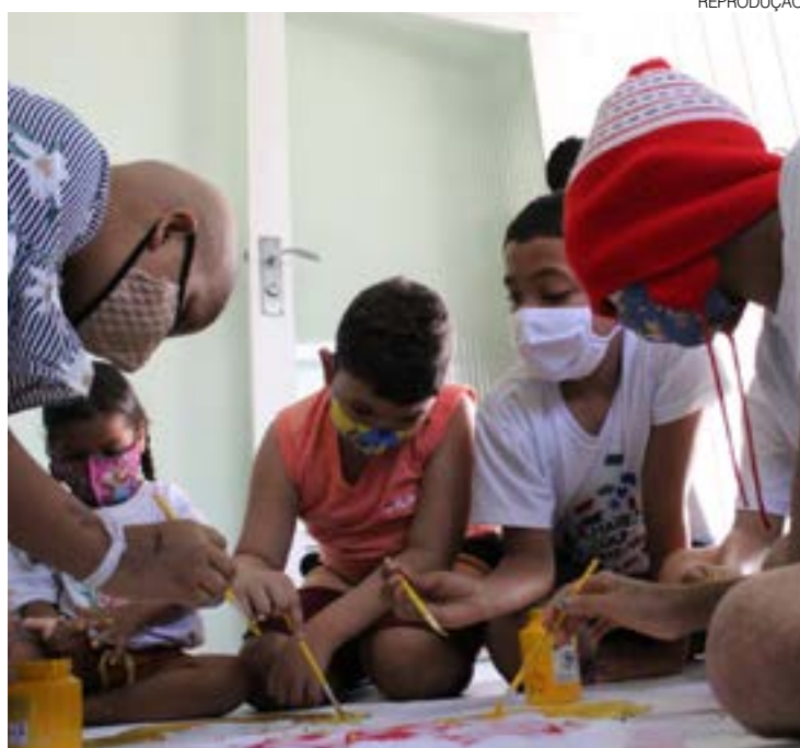
As doações podem ser entregues na instituição, em qualquer horário e dia

Em caso de picada, o profissional ressalta os cuidados necessários e imediatos: “Lavar o local com água e sabão, aplicar compressa de água morna no local da picada para alívio da dor. Se possível, tirar foto do animal e procurar o serviço de saúde mais próximo em caso de acidentes”.