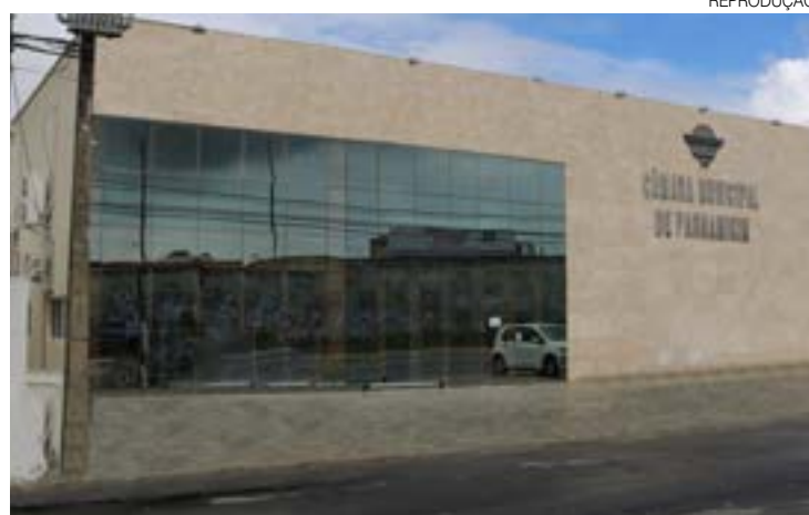
Vereadores receberam mais de R$ 10 mil em diárias em 2022