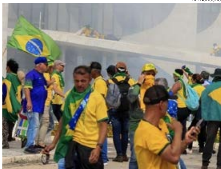
Após ataques em Brasília, CBF pede para Nike um estudo da cor

A entidade divulgou nota oficial avisando que é totalmente contra a utilização da camisa amarela em atos golpistas. “A CBF é uma entidade apartidária e democrática. Estimulamos que a camisa seja usada para unir e não para separar os brasileiros. A