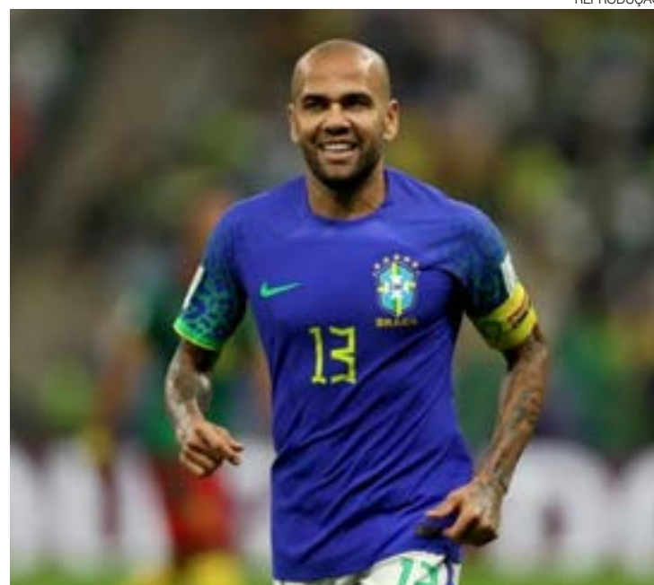
Ex-jogador da seleção teria tocado em mulher por debaixo da saia

O tribunal de Barcelona aceitou uma denúncia da polícia local contra o ex-lateral do Barcelona Daniel Alves por uma queixa de assédio sexual, conforme a agência Reuters. O ex-jogador da seleção brasileira teria assediado uma mulher, “tocando” por debaixo da saia, em uma boate em Barcelona na noite de 30 de dezembro. O atleta de 39 anos e que atua pelo Pumas do México nega tudo. Durante entrevista a um programa de TV na Espanha, Alves alegou que estava apenas dançando, sem invadir o espaço de ninguém. Ele afirmou ainda não conhecer a autora da denúncia e disse não ter “que perguntar quem está no banheiro” quando quer usá-lo. A polícia não esclareceu se o suposto assédio teria ocorrido no banheiro.