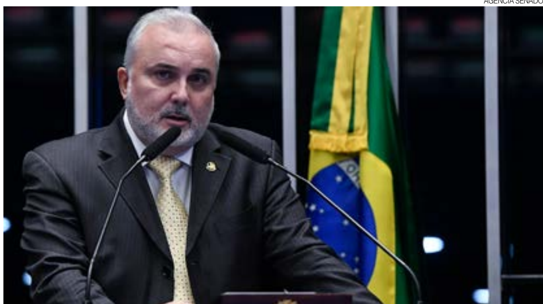
Jean: "As investigações chegarão aos organizadores e financiadores e todos devem responder à justiça!"