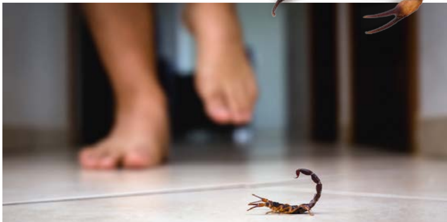
Tipo mais comum no Estado é o escorpião amarelo, responsável por quase quatro mil acidentes em 2022, sendo três óbitos notificados

de acidentes e informa que o tipo mais comum no RN é o Escorpião Amarelo do Nordeste (Tityus Stigmurus). “Durante o ano de 2022 foram registrados 3.951 notificações só para escorpiões (fonte do SINAN NET)