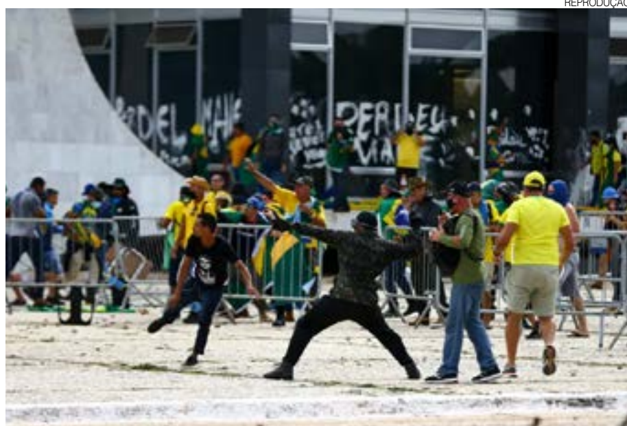
Terroristas destruíram prédios dos três poderes, em protesto contra derrota de Bolsonaro

cimento e conquista de votos, se comprometeu, entre outras coisas, a reconhecer as decisões que forem tomadas pela maioria na Casa; colocar as iniciativas que vierem do governo Lula dentro do trâmite normal do Senado e conversar com atores políticos que tenham os mesmos propósitos que ele.