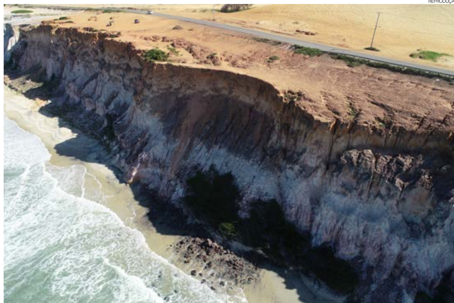
Beleza e perigo residem no mesmo local: orientação é que população evite ficar próximo às áreas de falésias, seja em cima ou embaixo destas

Parnamirim, Nísia Floresta, Tibau do Sul e Baía Formosa são algumas das praias que reúnem as condições de risco para acidentes com falésias, a alta