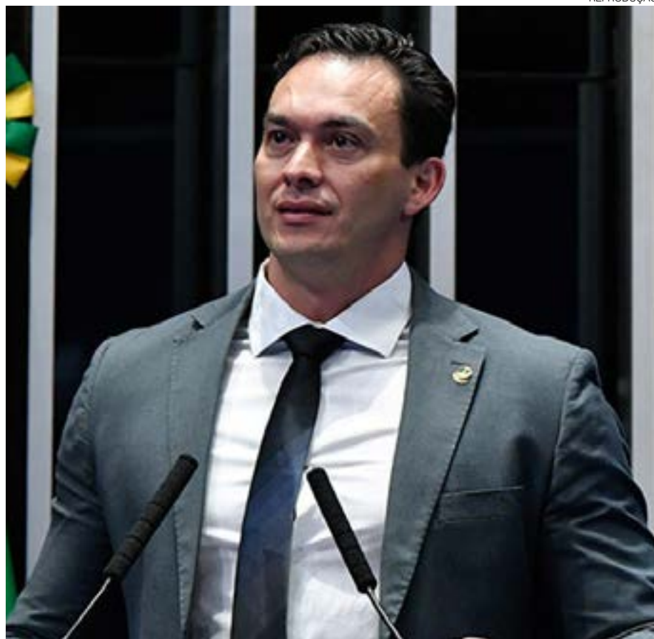
Styvenson: "Não acho justo o governador ser destituído sem uma investigação profunda"

Girão afirmou que a intervenção seria uma intromissão do Judiciário nos demais Poderes, ferindo o disposto na Constituição. "Como já foi colocado fim aos atos, inclusive com a desmontagem dos acampamentos, e não há mais nenhum movimento subversivo ocorrendo, já tendo sido todos os prédios desocupados, não há fundamento constitucional para a manutenção da intervenção federal. Por isso, ao meu modo de ver, a intervenção federal não deve ser aprovada pelo Congresso Nacional".