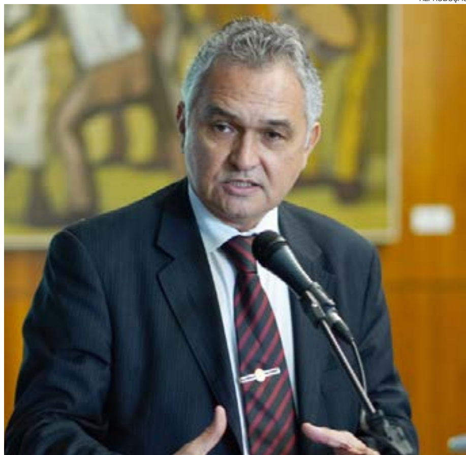
Girão vê golpistas bolsonaristas tratados como se estivesse em "campo de concentração"

Além de Girão e Styvenson, outros 17 parlamentares alinhados ao ex-presidente Jair Bolsonaro (PL), assinaram o documento em que questionam as condições dos golpistas detidos. No texto, eles afirmam que os terroristas "estão sendo tolhidos de condições básicas em termos de alimentação, hidratação e alojamento, havendo informações de que permaneceram em veículos