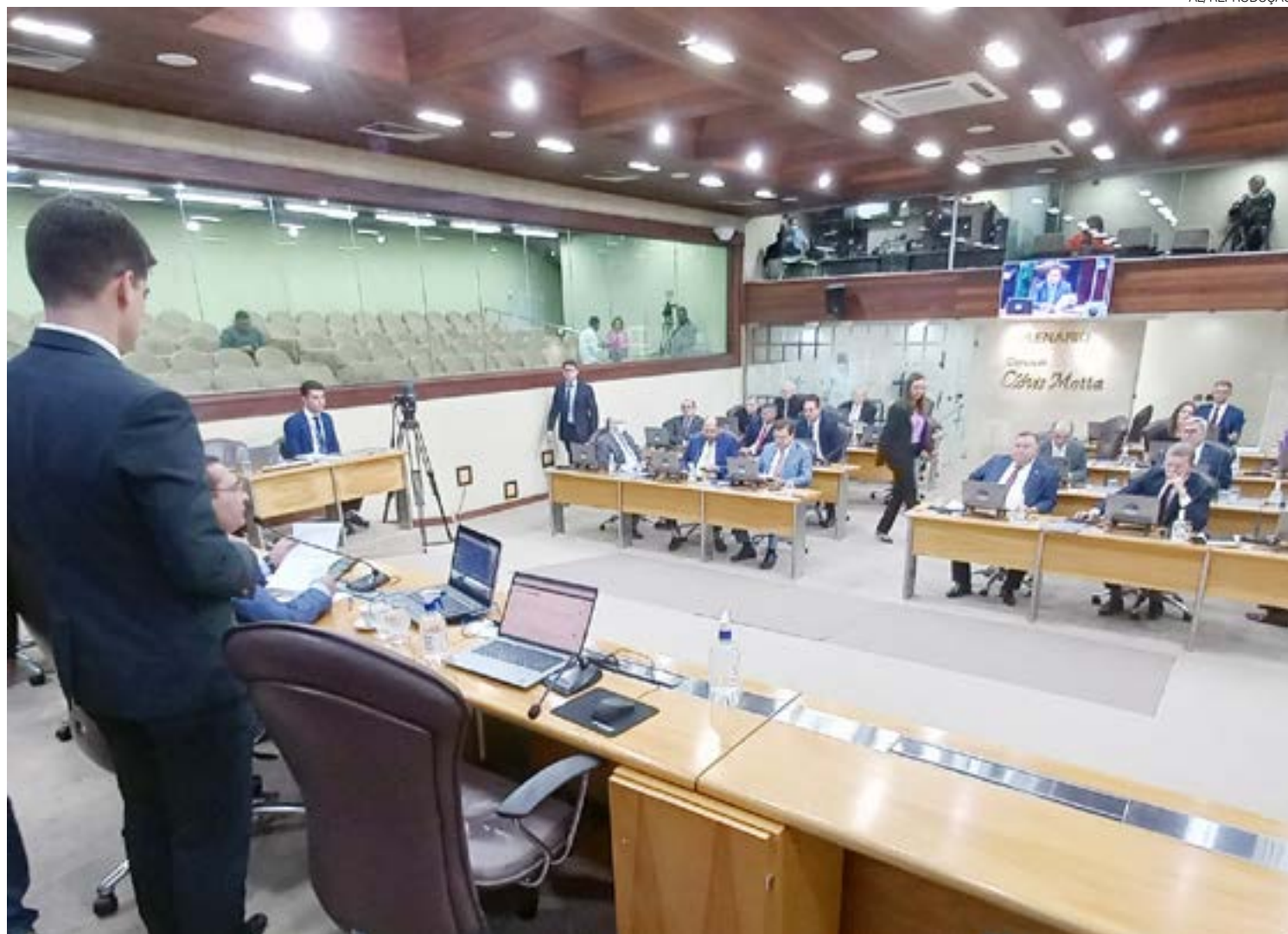
Proposta, aprovada por 12 votos a 11, reajusta alíquota modal de 18% para 20% e reduz ICMS de itens da cesta básica, de 18% para 7%

No entanto, a gestão estadual alega que, para que haja a compensação, é necessário que o executivo federal edite um decreto regulamentando o repasse, o que já está sendo negociado com a equipe da futura administração do presidente eleito Luiz Inácio