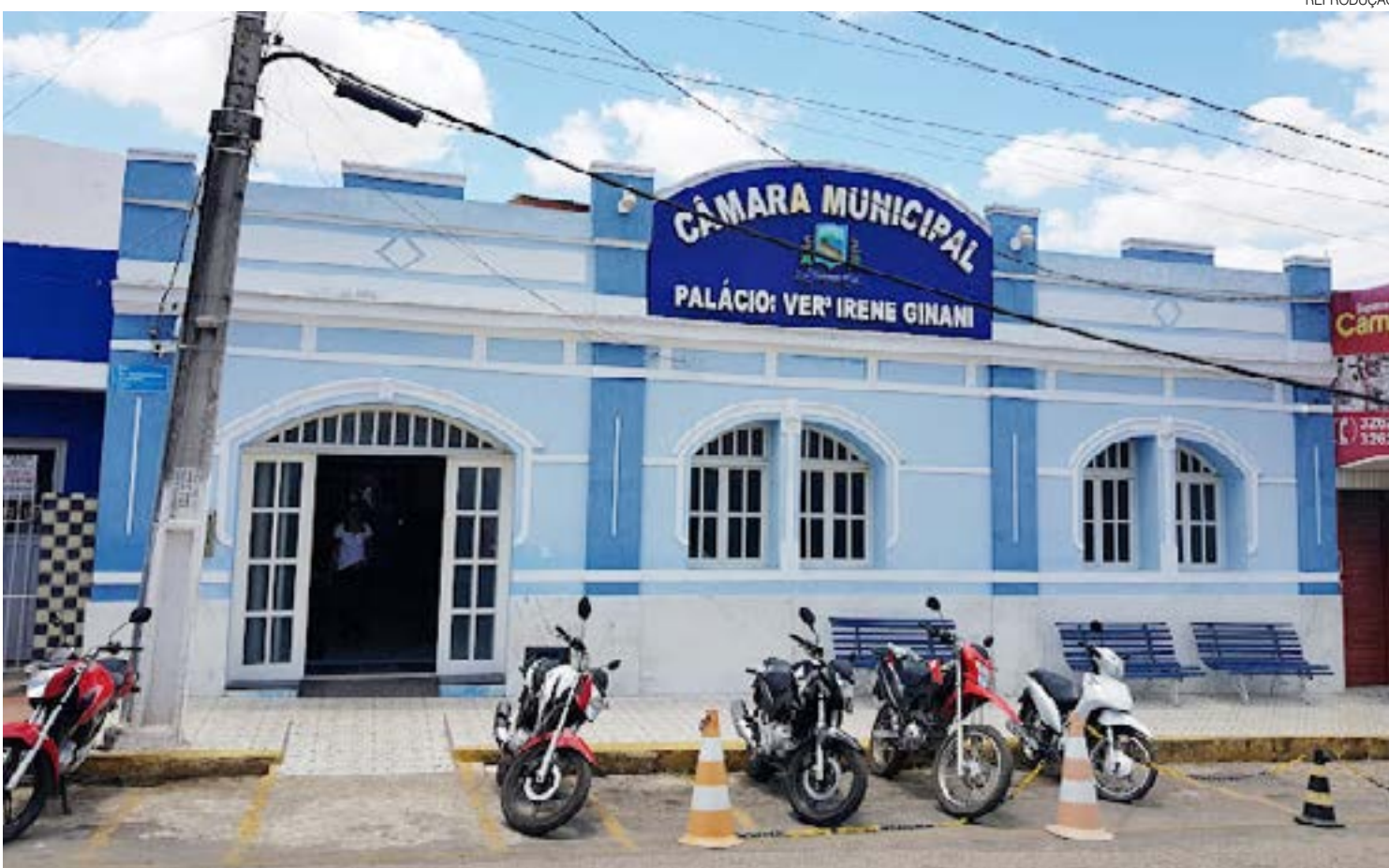
Sete, dos 13 vereadores de João Câmara, receberam valores acima de R$ 3,6 mil, referentes a diárias, entre janeiro e novembro deste ano

Verba indenizatória, as diárias são destinadas aos servidores que se deslocarem, a serviço ou aprimoramento (cursos, capacitações, treinamento e seminários), temporariamente no município, dentro ou fora do Estado, e aos vereadores que se deslocarem para fora do Estado.