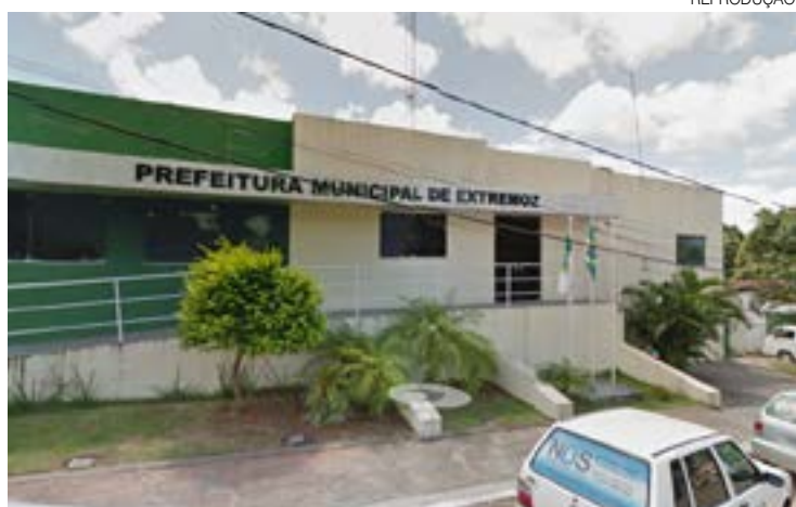
Município gastou mais de R$ 66,5 milhões entre janeiro e novembro

A folha salarial dos servidores públicos efetivos, terceirizados e contratados temporariamente do Município de Extremoz, Região Metropolitana de Natal, custou aos cofres públicos do 12º maior colégio eleitoral do Estado mais de R$ 66,5 milhões, entre janeiro e novembro deste ano. O valor representa 50,01% de toda a receita municipal arrecadada no mesmo período, que foi de aproximadamente R$ 133 milhões.