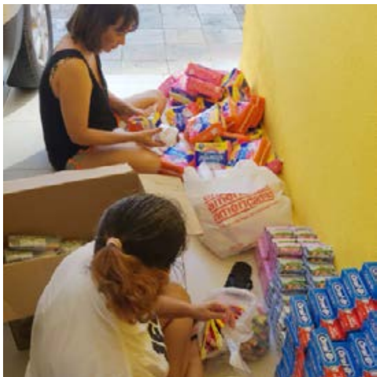
Ilane: “Minhas noites de Natal são baseadas no ensinamento do aniversariante”