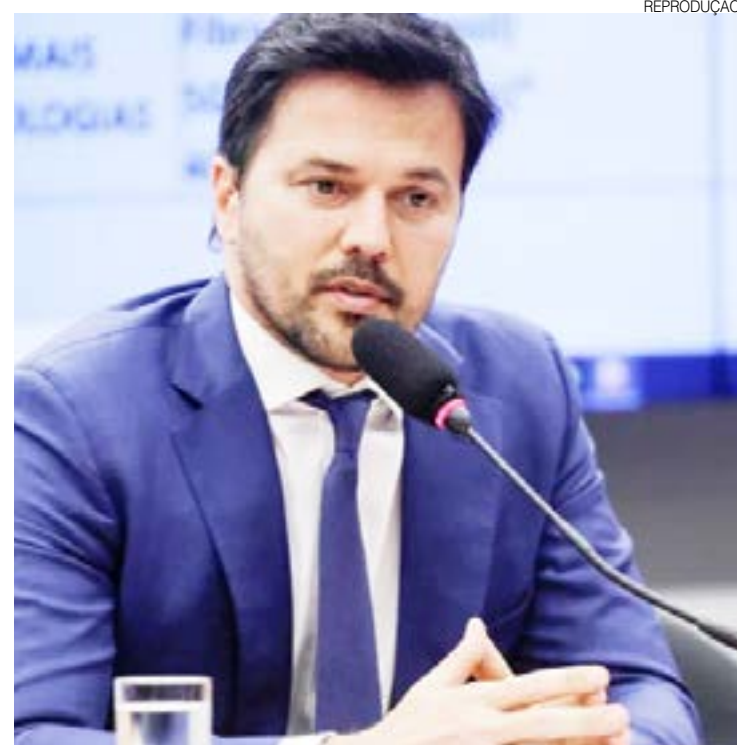
Filho de Robinson deixa Ministério das Comunicações e volta à Câmara