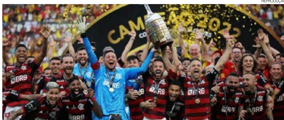
Campeão da Taça Libertadores, Flamengo será o representante sul-americano no Mundial de Clubes

Será a quarta final de mundial dos franceses. A primeira foi em 1998, quando conquistou o primeiro título justamente contra o Brasil, placar de 3 a 0. A segunda final foi em 2006 na derrota para a Itália e a terceira foi o bicampeonato de 2018 contra a Croácia, vitória por 4 a 2.