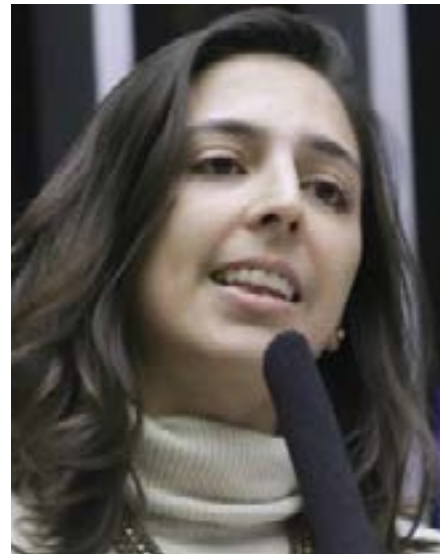
Natália restituirá R$ 16,7 mil ao Tesouro