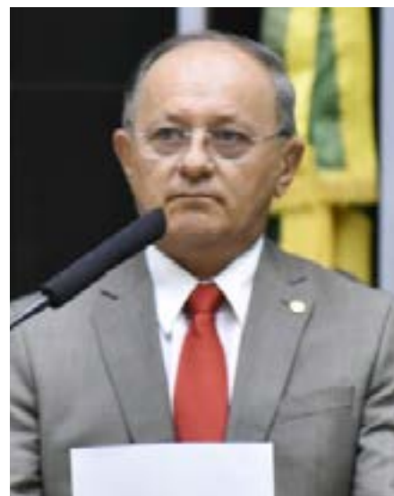
Benes devolverá R$ 37 mil à União