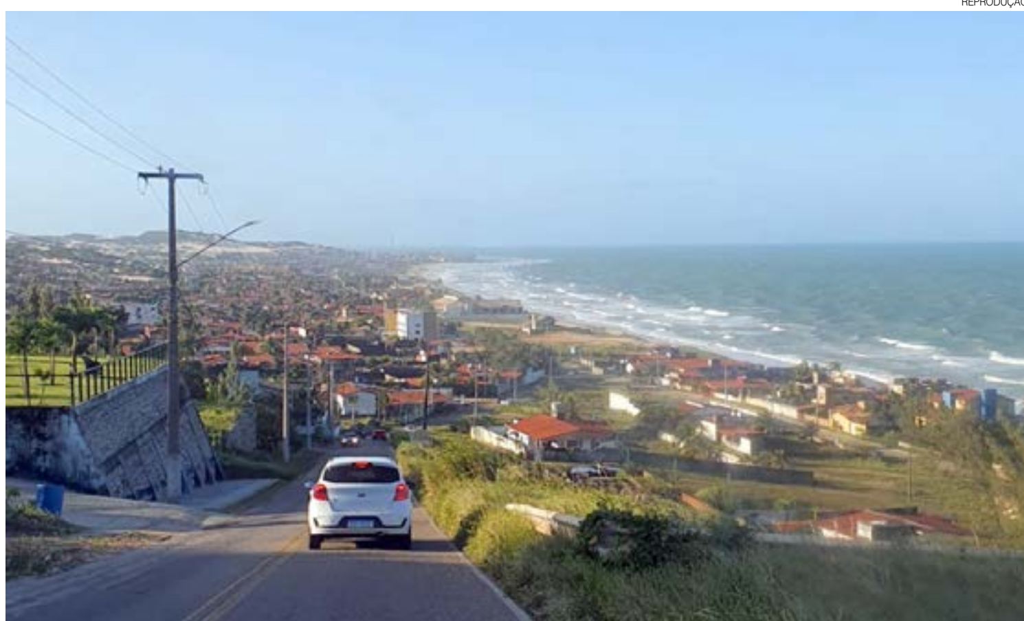
Bairros do Litoral Sul, como Cotovelo e Pirangi, são os mais procurados nesta época do ano; valores variam entre R$ 2,5 mil até R$ 15 mil mensais

Já o veranista que busca ainda mais conforto e comodidade, ou o que vem de outros estados e de outros países, acaba preferindo locações, sejam elas casas, apartamentos ou flats, já mobiliadas e em condomínios que já tenham opções de áreas de lazer. Os preços para quem procura es-