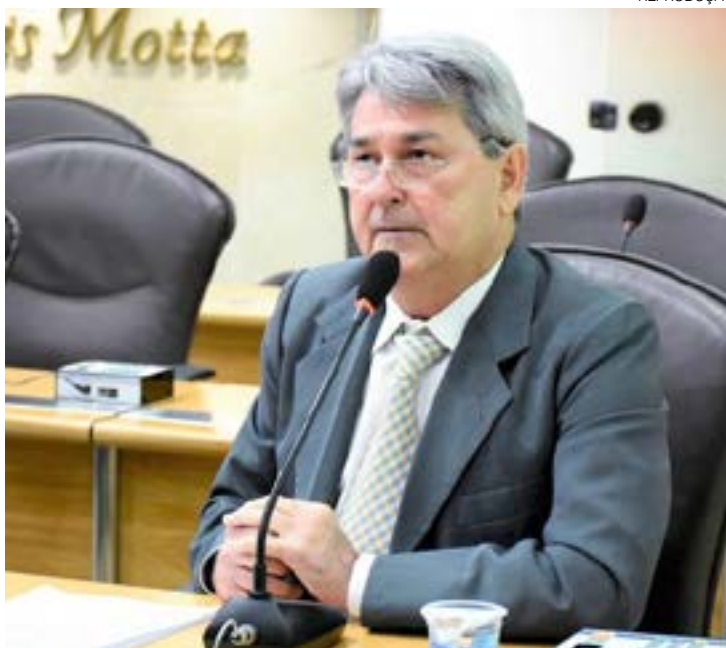
Tomba afirma estar confiante que não houve transgressão eleitoral

Referente à segunda irregularidade constatada, o relator afirmou que a Comissão de Análise de Contas Eleitorais do TRE solicitou esclarecimentos sobre a prestação de serviços de militância, com a apresentação de instrumento contratual ou documento similar