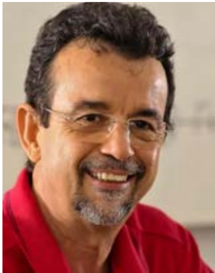
Mineiro terá que devolver R$ 78,6 mil