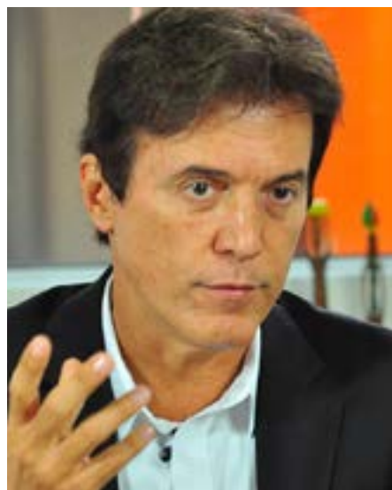
Robinson recorreu para não pagar R$ 216