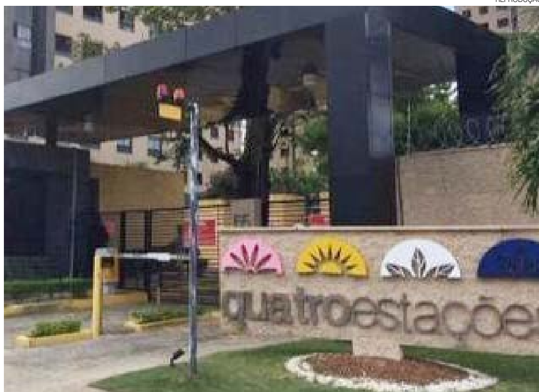
Médica e sua mãe cometeram agressão e racismo dentro de condomínio em Candelária, área nobre de Natal

“Não tenho nenhuma condição de voltar para casa neste