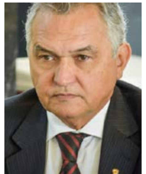
Girão terá que devolver R$ 25,6 mil

Apesar de terem que devolver dinheiro público do Fundo Eleitoral por irregularidades em suas prestações de contas, os parlamentares não sofrerão nenhum tipo de sanção referente às suas diplomações na próxima segunda-feira (19), na sede do TRE/RN. Segundo o procu-