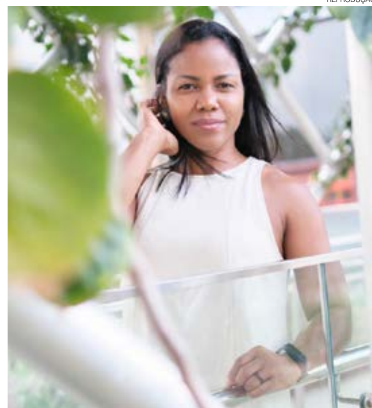
Vítima ainda tem receio de retornar ao seu imóvel, após injustiças

licitação de uma assembleia para tratar da expulsão das agressoras por conduta antissocial, mas ainda não se manifestou a respeito e, até o fechamento desta reportagem, não respondeu da equipe do Diário do RN. A defesa do condomínio também não se manifestou quando procurada.