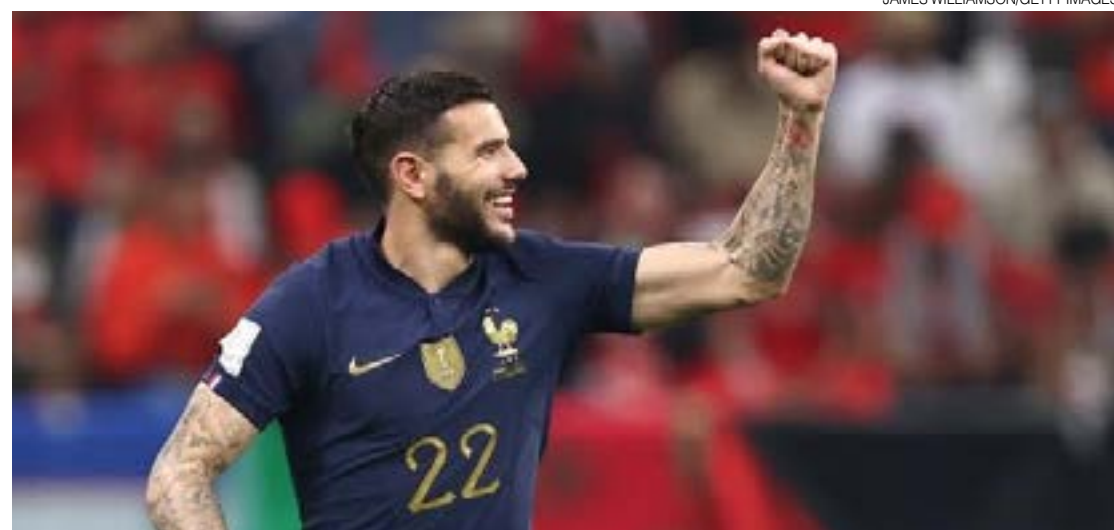
Theo Hernandez marcou um dos gols da vitória francesa sobre a Seleção de Marrocos, na semifinal