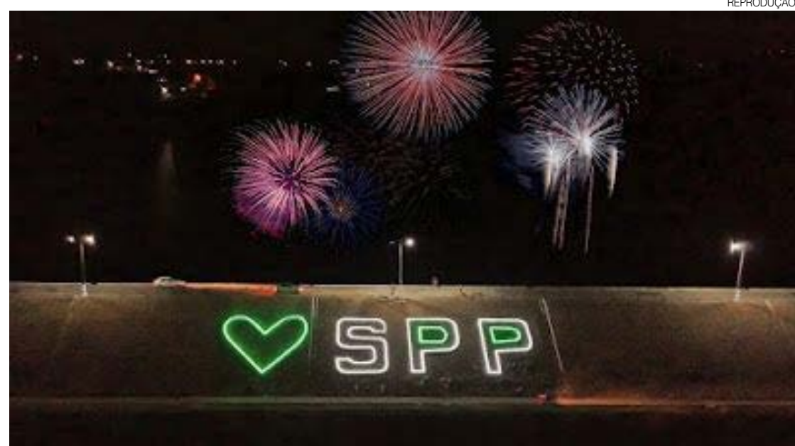
Município já está decorado e preparado para o evento natalino, que será permanecerá até o dia 31/12