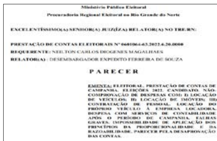
Parecer determinou a reprovação das contas do estreante na Assembleia