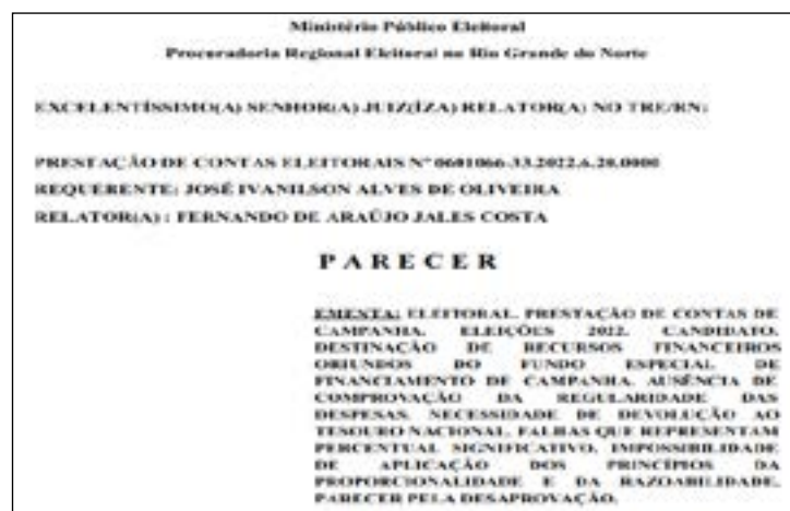
Parecer do MPE reafirma reprovação e determina devolução

Telles destacou que, referente à ausência de informações essenciais nas notas fiscais de contratação da empresa Bella Eventos Eireli para a subcontratação de veículos, não foram apresentadas