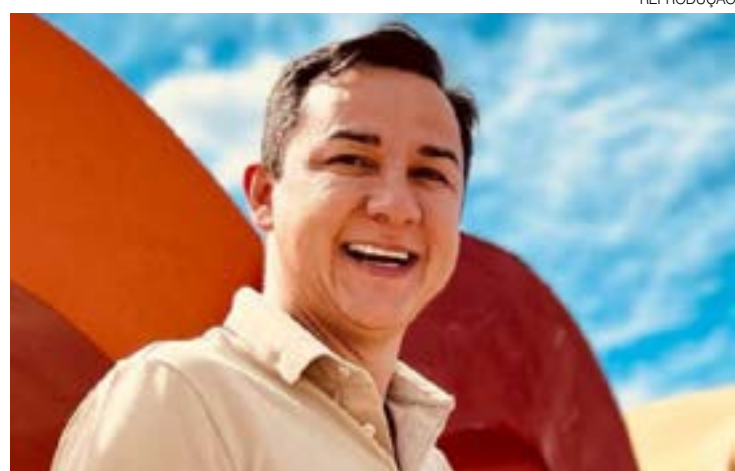
Futuro deputado locou o próprio veículo à empresa locadora

Em relação à locação de veículos, há despesas não comprovadas que representam 40,1%