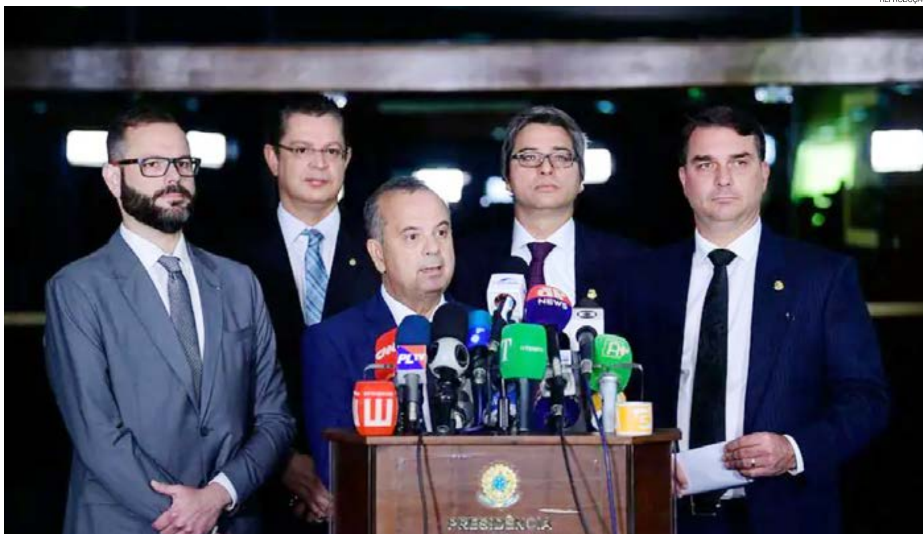
Apesar de ter ao seu lado o filho do presidente, senador Flávio Bolsonaro, Rogério Marinho evitou tocar no nome de Bolsonaro na coletiva de lançamento da candidatura

“O papel do legislativo é votar e discutir, o que não tem acontecido, inclusive, nos últimos tempos. A Comissão de Constituição e Justiça do Senado se reuniu esse ano seis vezes. Isso, prejudicou a qualidade da produção legislativa do parlamento brasileiro. Isso não é ser contra ou a favor de ninguém, na verdade, é impedir que o exercício pleno de quem legisla seja exercido. E nós não faremos nem agiremos dessa forma. Temos interesse de permitir que haja o exercício pleno de se