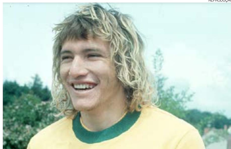
Marinho Chagas foi o grande destaque do Brasil na Copa de 1974, na Alemanha

“Marinho Chagas foi um jogador de estilo elegante, de um futebol vistoso, vibrante e ofensivo, apesar de jogar na lateral. Um jogador que antecipou o seu tempo, atuando como ala. Um fato marcante é que quatro anos depois de ter saído do futebol potiguar, disputou a Copa do Mundo”, lembra o pesquisador.