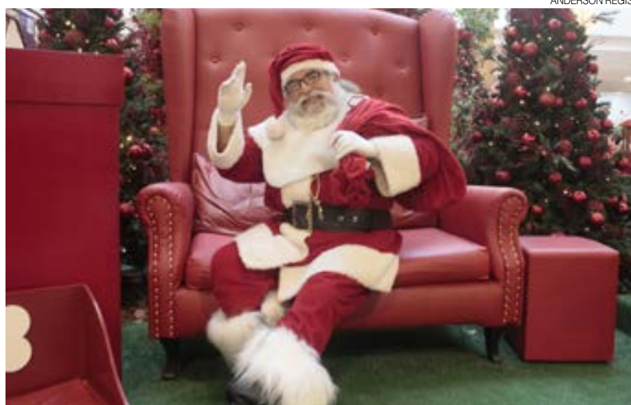
Crianças potiguares mantêm tradição de fazer cartinha de pedidos para o Papai Noel

“Uma vez, um menino escreveu: Querido Papai Noel, eu não vou mais bater no meu irmão. Quero uma bicicleta”. Já os momentos de interação com as crianças são sempre uma incógnita, revela Jorge. “Algumas são mais curiosas, querem saber se a barba é de verdade, também tem os que ficam com vergonha e outras crianças mais elétricas. É tudo uma paz, a gente se condiciona ao natal e as pessoas são mais amáveis”. Em outros momentos, o trabalho coloca o Papai Noel