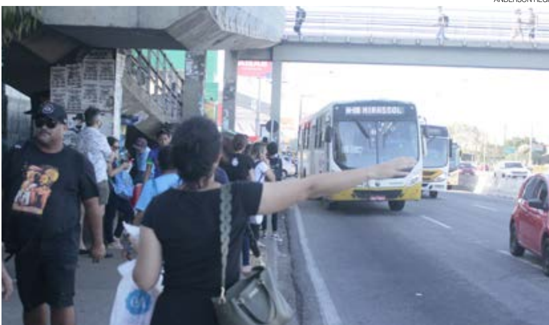
Usuários de transporte coletivo em Natal reclamam de condição precária dos veículos em uso na cidade

Nesta quarta-feira (7), a reportagem do Diário do RN encontrou paradas lotadas na BR-