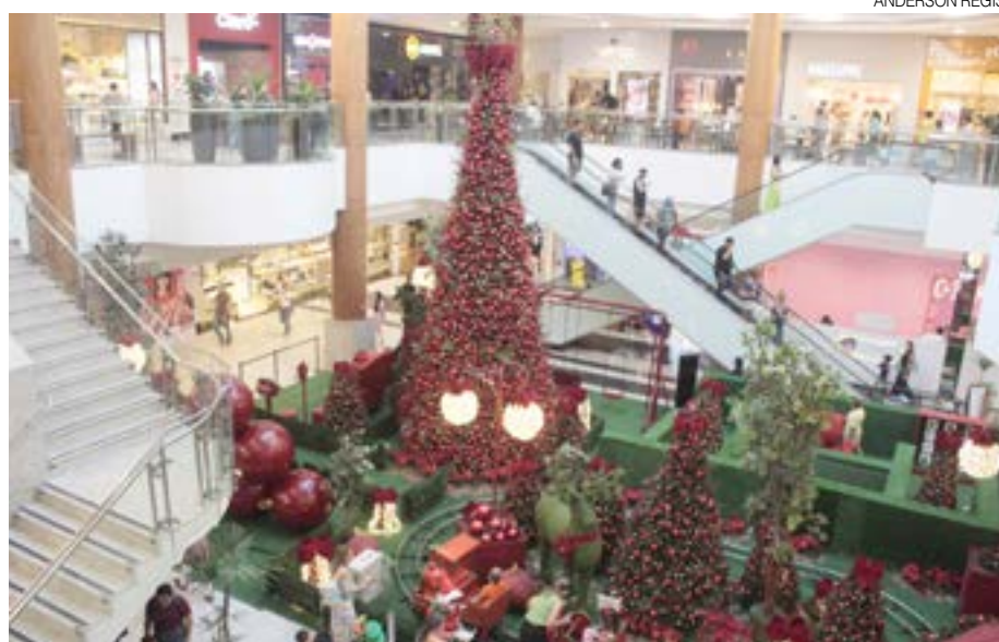
Comércio natalense já está preparado e decorado com o clima encantador do Natal

cebemos que as famílias não deixam de ir à decoração, de visitar o Papai Noel, elas fazem questão de viver esses momentos, dando a sensação de que o espírito natalino supera essa interferência da Copa na nossa dinâmica. Claro que nos dias de jogos do Brasil o pessoal fica envolvido com isso, mas nos outros dias percebemos os clientes buscando itens de Natal, fazendo as compras de presentes e, claro, visitando a decoração natalina, que é um grande atrativo nesse período”.