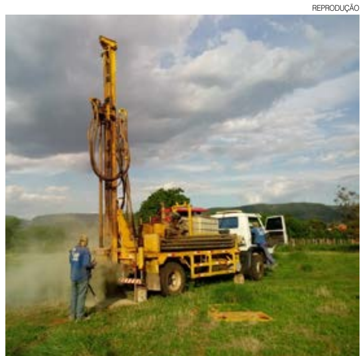
Foram construídos 1.651 poços artesianos nos últimos 11 meses no RN