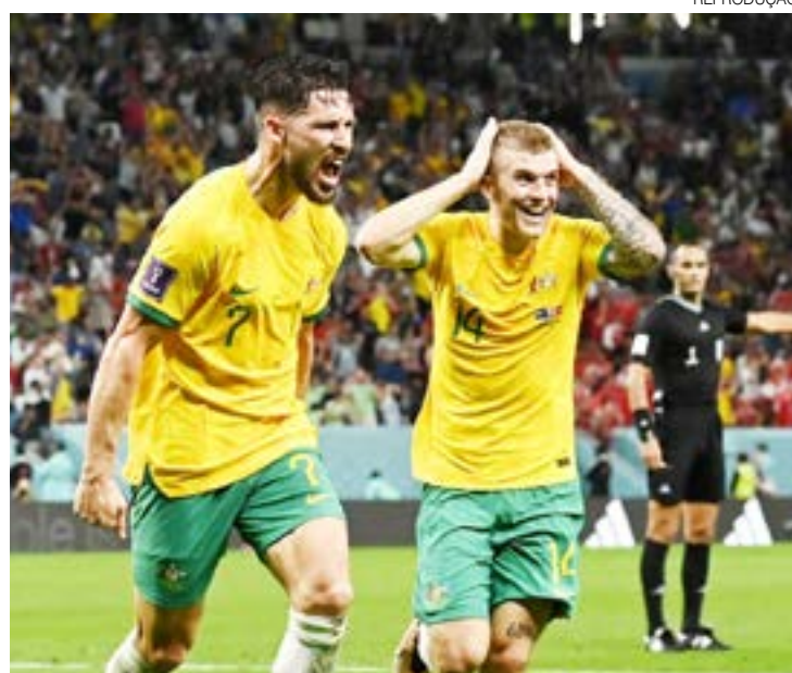
Australianos encerraram a fase de grupos em segundo lugar

A zebra pegou todos de surpresa no Grupo D. Nesta quarta-feira, no Estádio Al Janoub, em Al Wakrah, Austrália e Dinamarca jogaram pela última rodada do Grupo D da Copa do Mundo do Catar 2022. Com a vitória por 1 a 0, os australianos ficaram em segundo na chave e avançaram no torneio, com os dinamarqueses sendo eliminados. A Tunísia também surpreendeu ao bater a França por 1 a 0, mas o resultado não foi suficiente para a classificação devido a vitória australiana, mas entrou para a trajetória dos tunisianos como a primeira vitória diante de um time europeu. Mesmo com a derrota, a França se classificou em primeiro lugar e vai enfrentar a Polônia nas oitavas de final.