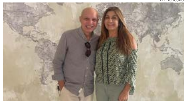
Promoters estão trabalhando a todo vapor para o Réveillon 2023

O clima ainda é de Copa do Mundo, mas dezembro chegou e logo as tradicionais festas de fim de ano batem à porta. Para quem gosta de planejar com antecedência, as opções já começam a ser divulgadas.