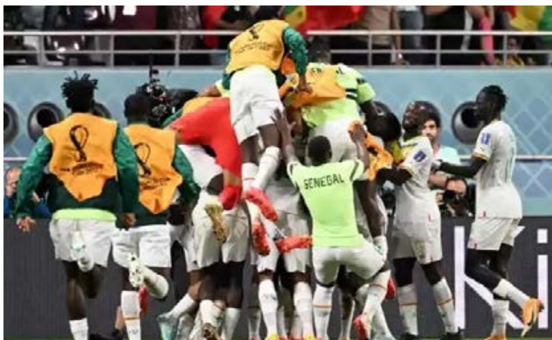
Senegal venceu o Equador pelo placar de 2 a 1 e vai enfrentar a Inglaterra pelas oitavas de final no dia 4

A Copa do Mundo do Catar conheceu ontem os primeiros confrontos das oitavas de final. Pela última rodada da fase de grupos, se classificaram Holanda e Senegal pelo Grupo A e Inglaterra e EUA pelo Grupo B. Com gols de Cody Gakpo e Frenkie de Jong, a Holanda venceu o Catar por 2 a 0 e terminou em primeiro lugar. Os adversários dos holandeses nas oitavas de final serão os americanos, que venceram o Irã por 1 a 0 e encerram em segundo lugar, com cinco pontos, pelo Grupo B. O jogo será no sábado (3), às 12h.