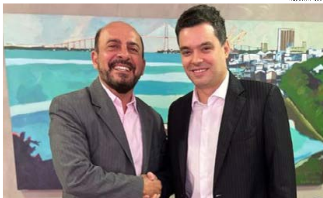
Encontro entre Antenor e Walter ocorreu nesta terça-feira (29) na sede da vice-governadoria, em Natal

Trocamos ideias sobre os novos desafios da gestão, como a revisão na estrutura administrativa e nas políticas sociais