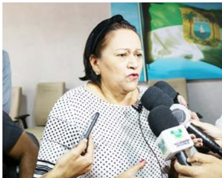
Governadora Fátima Bezerra terá que responder ao MP Eleitoral

No caso das dez empresas com número reduzido de empregados, o que indicaria falta de capacidade operacional, os dados foram encontrados por meio da ferramenta de consolidação e busca de dados, criado pelo Mi-