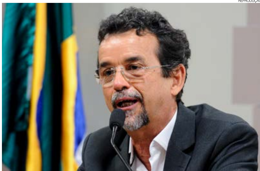
Mineiro: “Os prestadores de serviços mencionados pelo MPE estão devidamente regulares na Receita”

“Aponta possível transferência de valores de origem pública sem a efetiva contrapartida do fornecimento de bens ou serviços, o que pode evidenciar des-