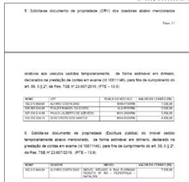
TRE pediu ainda os documentos dos quatro veículos cedidos

mente, de forma estimável em dinheiro, declarados na prestação de contas de Adjuto Dias. Um dos veículos também per-