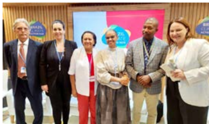
Fátima: "O RN e Nordeste têm protagonismo nas energias renováveis"

"Nos une a luta pela sustentabilidade, o enfrentamento à degradação do clima, e também a participação das mulheres na administração pública. O RN e o Nordeste têm protagonismo nas energias renováveis e geram