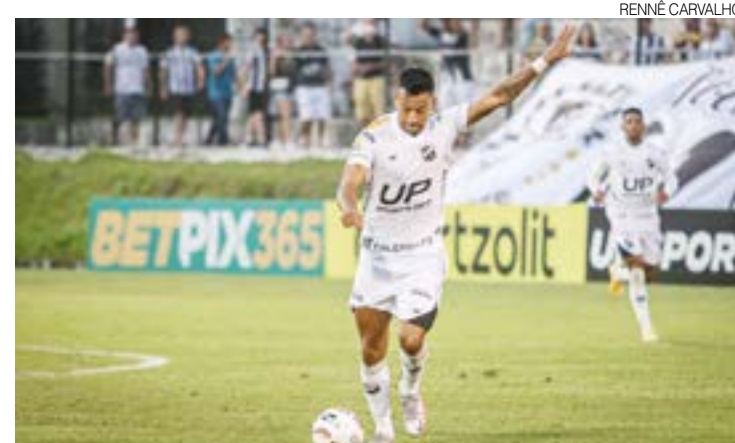
Atacante marcou o gol da vitória na primeira fase contra os paulistas