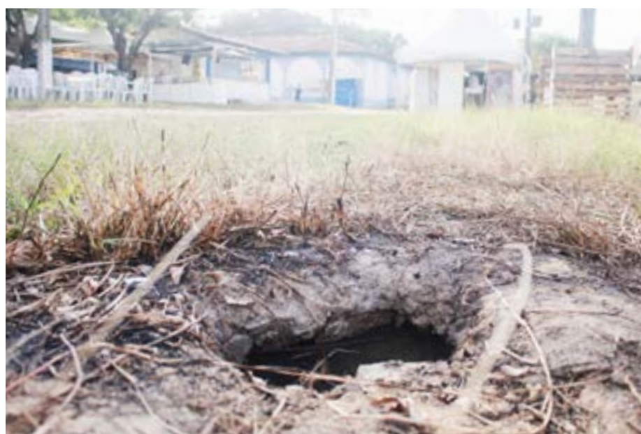
Fossa aberta próximo a estandes oferece riscos de acidentes graves aos visitantes

Através dos trâmites legais, a segurança do evento foi asse-