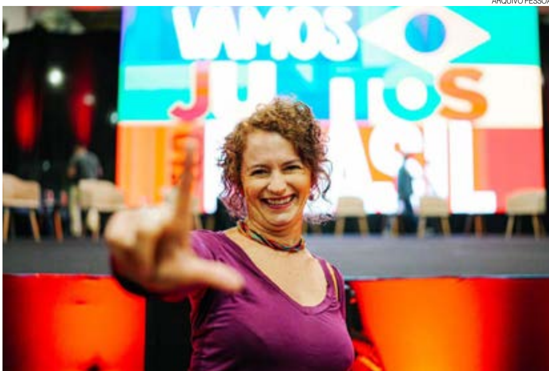
Isolda: “Muito egocentrismo e pouca humildade. O eleitor reprovou isso. Com uma derrota muito grande”

Questionada sobre o fato de ter sido a mulher mais votada para a Assembleia Legislativa, a parlamentar petista creditou os