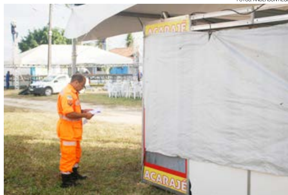
A falta de aterramento das tendas foi outro ponto para ser corrigido, aponta AVCB

gurada pela Diretoria de Atividades Técnicas do CB. Segundo o integrante da DAT, coronel Edson Modesto, o Auto de Vistoria do Corpo de Bombeiros (AVCB) do Parque Aristófanos Fernandes está em dia. E, segundo ele, a própria Festa do Boi também foi protocolada pela corporação. Com relação à estrutura montada para o evento, o AVCB da estrutura temporária só deve ser emitido uma hora antes do evento.