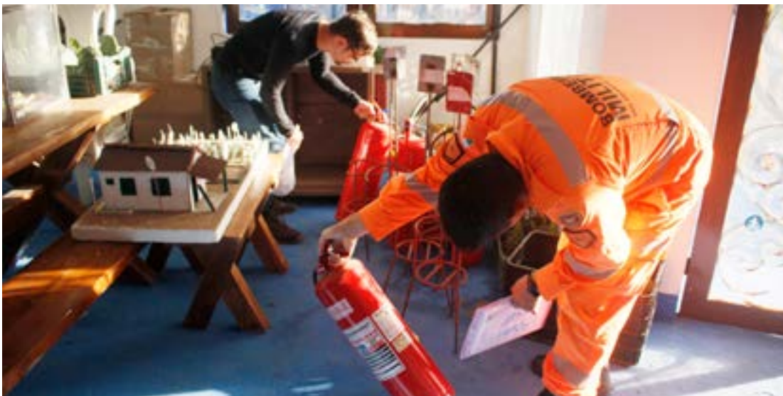
Bombeiros encontraram extintores vencidos, o que coloca a população em risco em caso de incêndio

A Festa do Boi deve movimentar R$ 65 milhões através de shows, atrações culturais e os 300 estandes de exposição durante todo o evento, que ocorre entre os dias 8 e 15 de outubro. Em comemoração ao seu Jubi-