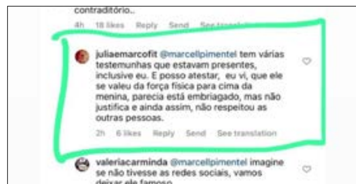
Nas redes sociais, relatos de que conduta do advogado não é novidade

escrever uma carta sobre o episódio, ele prefere não falar mais. O secretário-geral da OAB-RN, afastado até apuração dos fatos, diz que está sendo "condenado nas redes sociais, antes de ter o direito a falar a minha versão". Segundo ele "tudo não passou de um pequeno esbarrão involuntário, destes que acontecem em festas, pois o local estava com muita