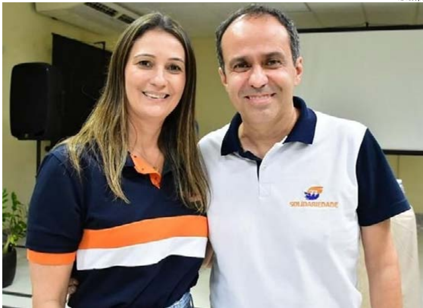
Deputada estadual Cristiane Dantas, ao lado do esposo, ex-vice-governador Fábio Dantas, candidato a governador do RN, pelo Solidariedade

São montantes usados de verbas de gabinete que chamam a atenção principalmente pelo fato do Rio Grande do Norte ter, aproximadamente, 154 mil potiguares em situação de pobreza, quando precisam sobreviver com valores