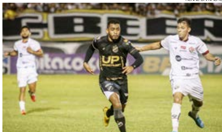
ABC não conseguiu vencer o Vitória e decidirá vaga contra o Paysandu

A segunda chance de obter o acesso sem depender de resultados será novamente diante do Frasqueira. O jogo que vai definir o retorno à Série B será contra o Paysandu/PA, no Frasqueirão. Somente a vitória interessa