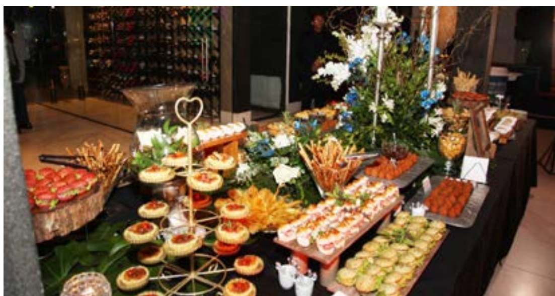
Os Bufftes foam assinados por Renata Motta e Versailles. Uma delícia!