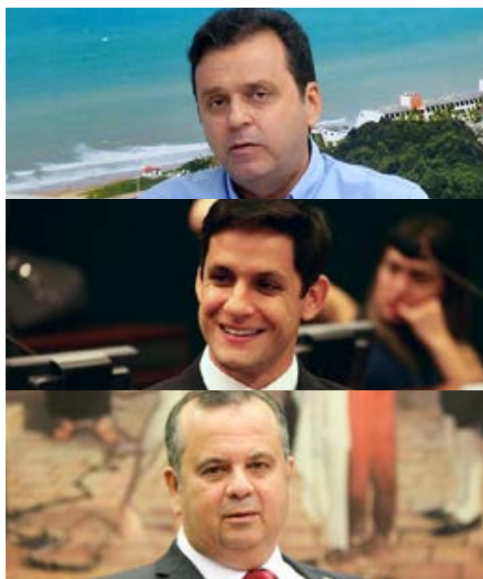
Jornalista - Diretor Executivo do Diário do RN

Assim, além do imbróglio partidário, a disputa senatorial segue indefinida e promete ainda lances emocionais que, além da criatividade de seus marqueteiros, estarão escritos a partir dos protestos de seus protagonistas junto ao Tribunal Regional Eleitoral, (TRE).