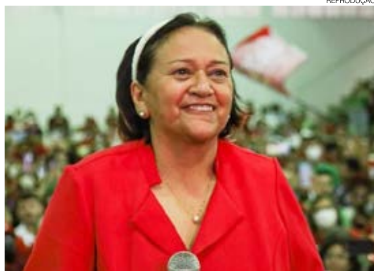
Fátima ainda não divulgou quem assumirá as pastas mais críticas

ALESSANDRA BERNARDO ALEBERNARDO1982@GMAIL.COM