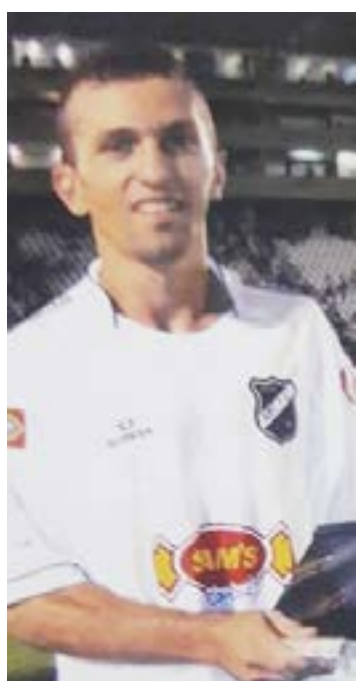
Lateral teve conquistas importantes pelos dois maiores clubes do RN