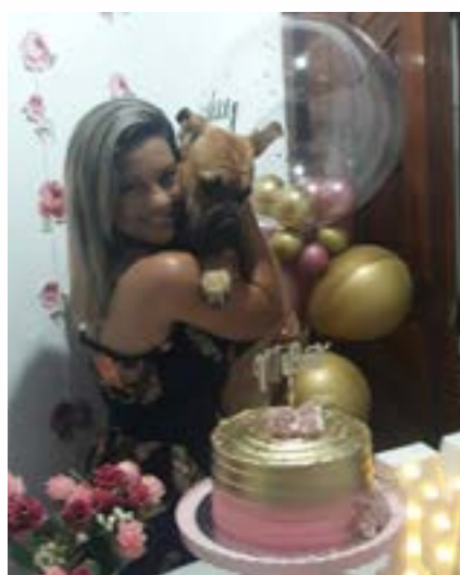
Milka e Luna