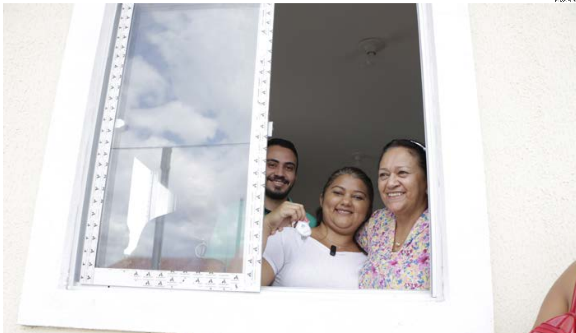
Governadora se emocionou na entrega: “Essa ação significa cidadania, respeito e dignidade. É o resultado de muitos sonhos e não existe maior do que ter sua casinha”

As casas já foram entregues com a escritura pública registrada em cartório e no nome dos titulares, que também receberam