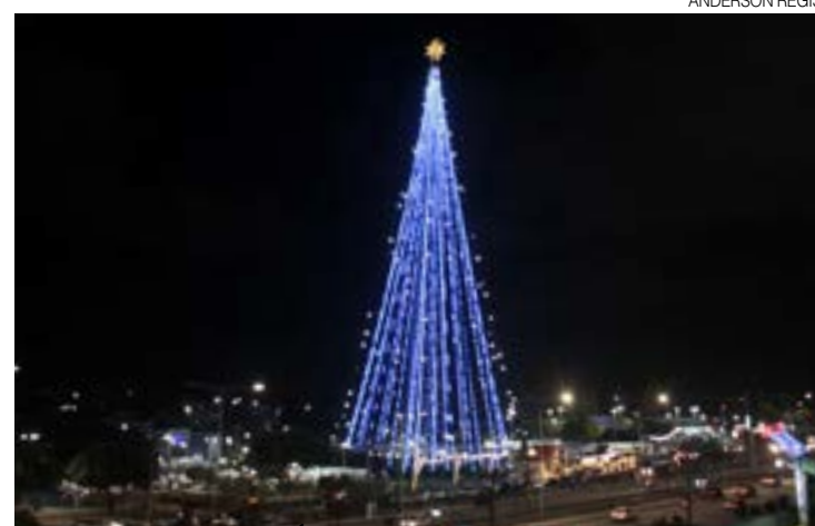
Eventos no entorno da Arvore de Mirassol são gratuitos, para todos