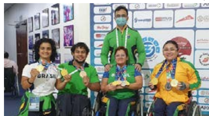
Atletas da SadeF fizeram parte da seleção brasileira paralímpica

tados, apenas 6 a menos que o compatriota Bruno Carra, que ficou com a prata. O Brasil terminou a competição com 12 pódios: seis ouros, três de prata e três de bronze.