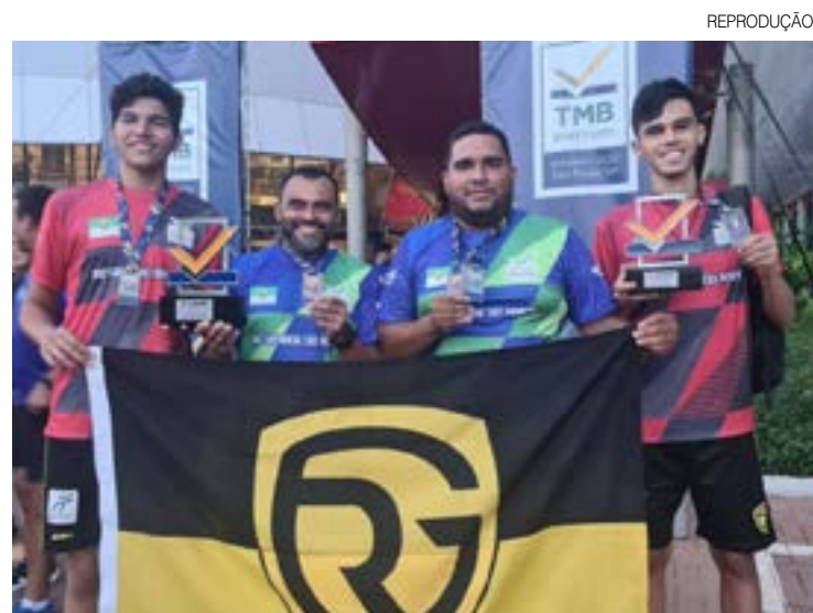
Time de tênis de mesa do Desportivo enfrentou os melhores do Brasil

cada ano, totalizando 1%. No final de 2014, ele foi negociado ao Fluminense, onde passou quatro anos, até ser vendido para o Spartak.