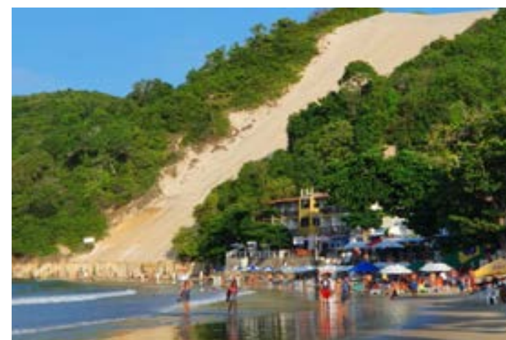
Temperatura média deve ficar em 26,4° chegando a 35° no Oeste e Seridó

Uma das principais empresas do segmento no estado, a Sterbom, vê o volume de vendas de todo o portfólio aumentar em até 30%. "O verão e calor característico desse período de ano, aumenta também o volume das vendas de 20% a 30%", enfatiza Leonardo Lucas, gerente de operações da Sterbom.