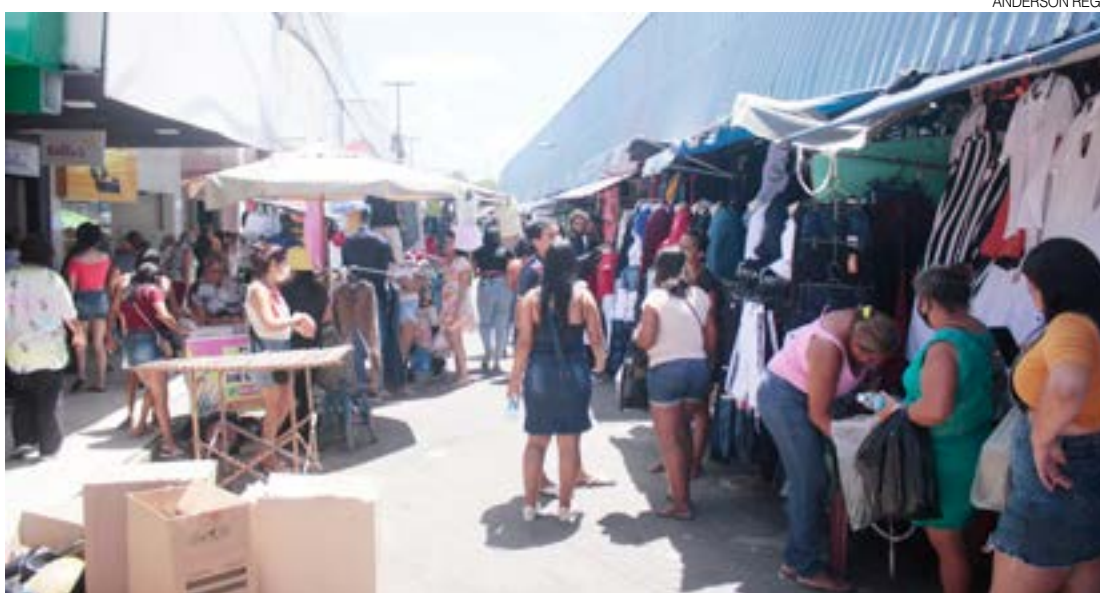
Associação comercial calcula cerca de 4 milhões de pessoas comprando em lojas Alecrim neste mês