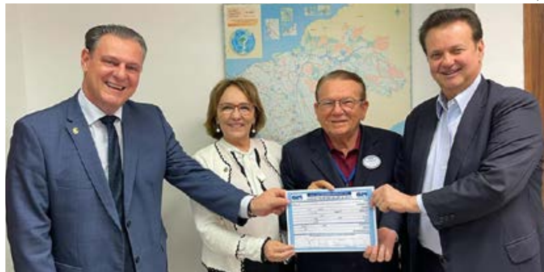
Senadora e secretário de Estado do Desenvolvimento Econômico se filiaram ao partido de Gilberto Kassab