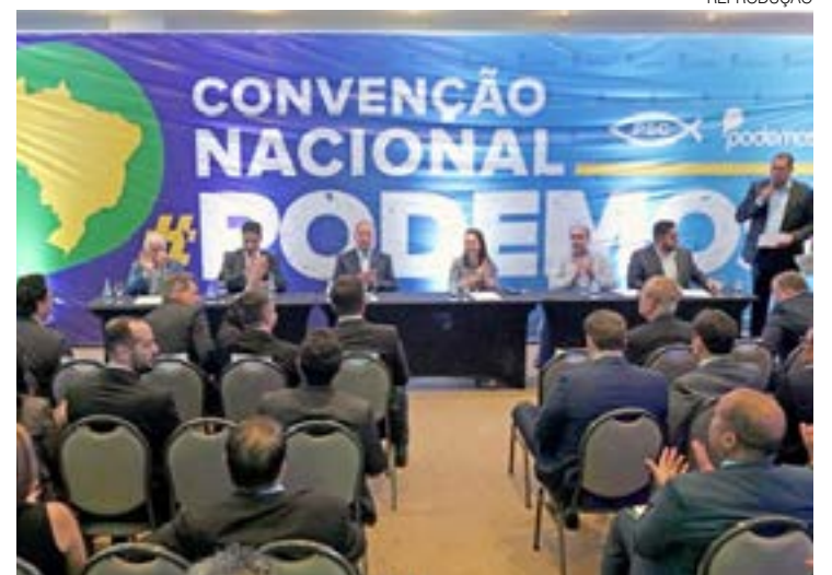
Formalização da incorporação ocorreu durante convenção nacional

O Podemos tem como principal filiado no RN o senador Styvenson Valentim, que disputou o governo do Estado e ficou em 3º lugar.