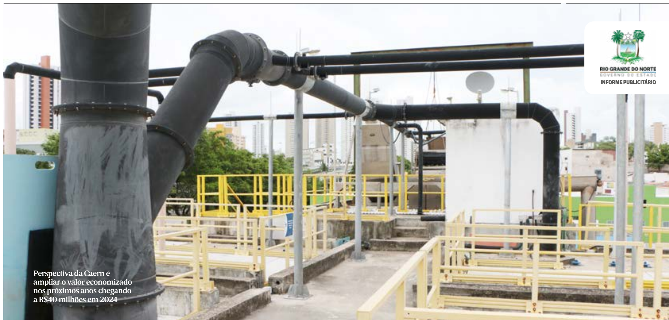
Perspectiva da Caern é ampliar o valor economizado nos próximos anos chegando a R$40 milhões em 2024