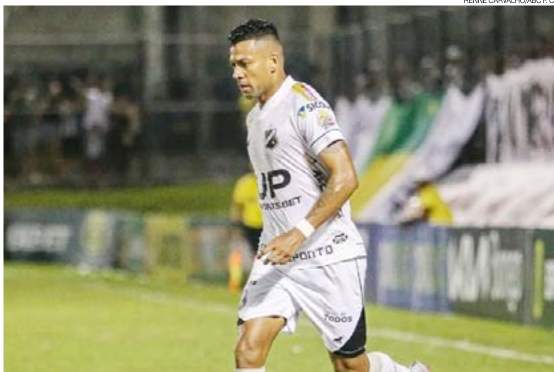
Atacante realizou 167 jogos e marcou 88 gols com a camisa alvinegra participando de várias conquistas