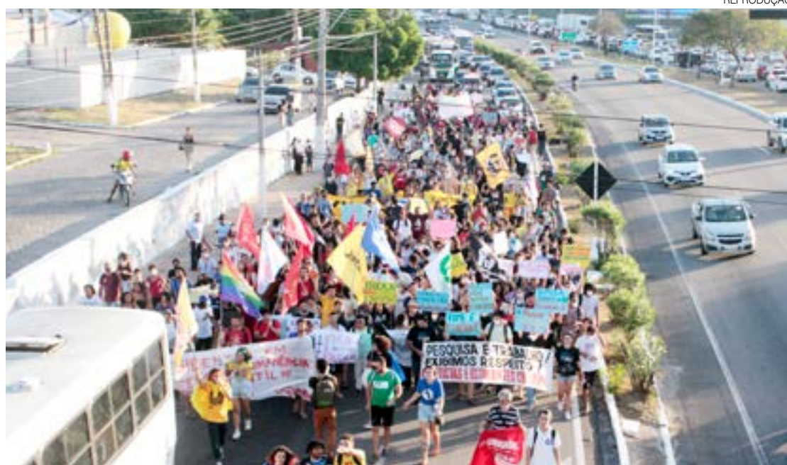
Universitários realizaram protesto contra bloqueios bilionários feito pelo presidente Bolsonaro na Educação