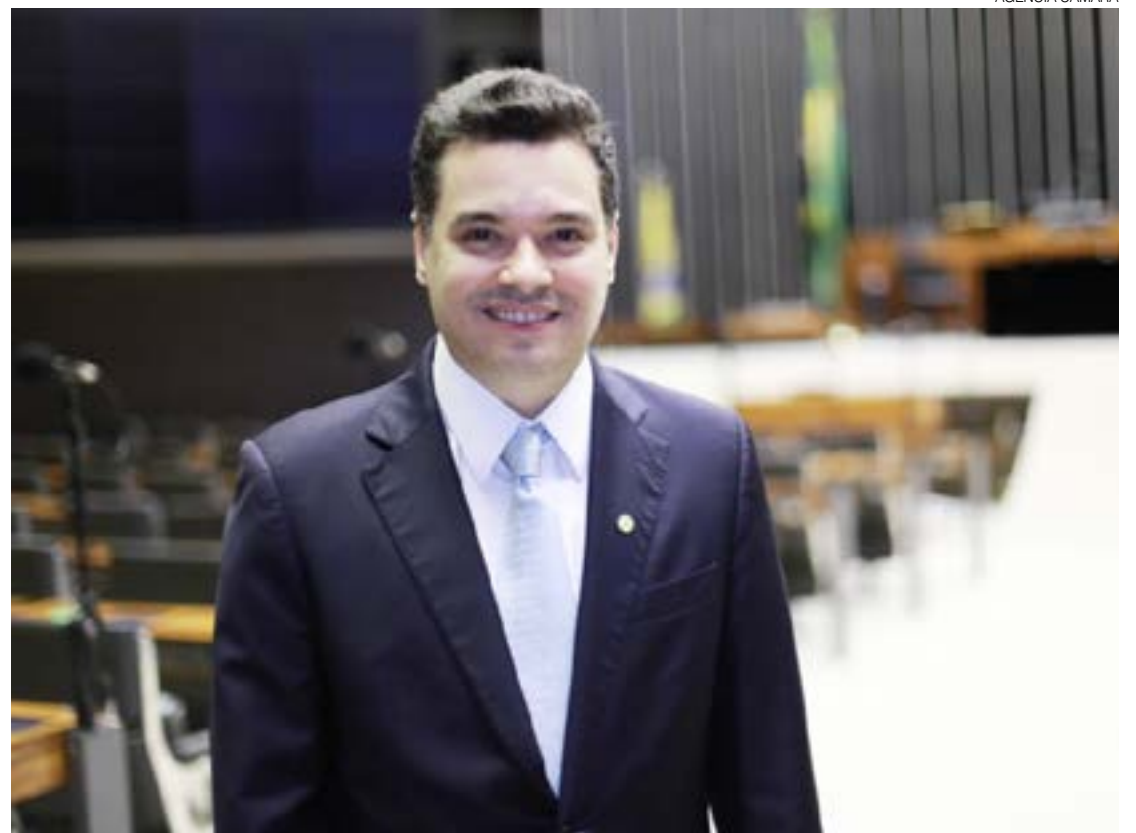
Walter: “Com a chegada de um presidente tão comprometido, nossas esperanças estão renovadas”

“A expectativa é a melhor de todas, certamente. A aliança e o relacionamento político de Lula e Fátima e do presidente e o MDB nacional é extremamente importante para o Estado. Com a chegada de um presidente tão comprometido com o Nordeste, nossas esperanças estão renovadas. Com certeza, tudo isso é e será muito importante para ajudar o RN, que foi assumido pela governadora Fátima em uma situação terrível e, com muito trabalho por parte da sua gestão, conseguiu recuperar a dignidade do potiguar”, afirmou.