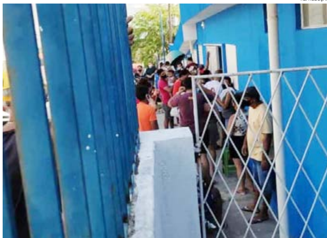
Aglomerado se formou na porta da UBS Pajuçara, na Zona Norte, na manhã desta segunda-feira (28)

Os médicos membros da Cooperativa Médica contratada pela Secretaria de Saúde do município de Natal iniciaram a paralisação para reivindicar o pagamento de salários atrasados desde o mês de julho. A reportagem do Diário do RN procurou a SMS, mas não teve retorno até o fechamento desta edição.