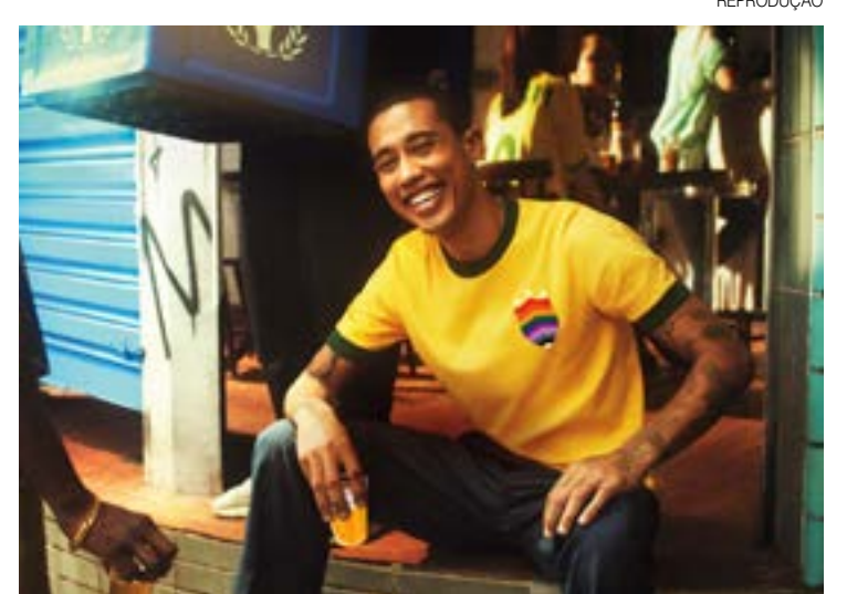
Aplicativo permite pesquisar rota dos melhores estabelecimentos

Através do site também é possível ter acesso a um canal onde as pessoas possam se sentir acolhidas em qualquer situação de preconceito que eventualmente ocorra nos bares. O SAC de Respeito da Copa funciona em horários de maior fluxo de operação dos bares durante a Copa do Mundo de Futebol. Caso qualquer pessoa passe por situações de discriminação, pode contar com o auxílio de uma equipe especializada, de forma segura e com a identidade preservada, que vai orientar o usuário sobre a melhor condução.