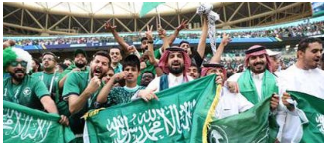
Em grande número, torcedores sauditas vibraram com a vitória contra os argentinos no estádio Lusail