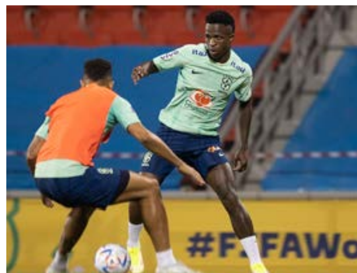
Vini vai forma o ataque ao lado de Neymar, Richarlison e Raphinha

Nesta quarta-feira, o time faz o último treinamento, seguido da entrevista coletiva do técnico Tite. O provável time contra a Sérvia deve entrar em campo com: Alisson, Danilo, Thiago Silva, Marquinhos e Alex Sandro; Casemiro e Lucas Paquetá;