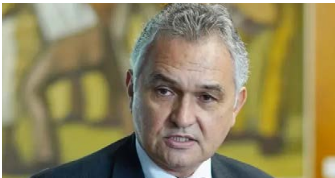
General Girão acredita que a anulação de urnas poderá significar a vitória de Jair Bolsonaro