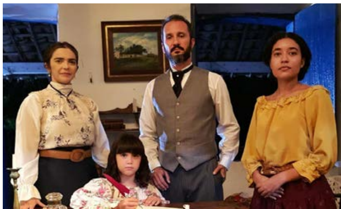
Filme potiguar "Dionísia, Poema Além da Floresta", também é destaque no Troféu Cultura