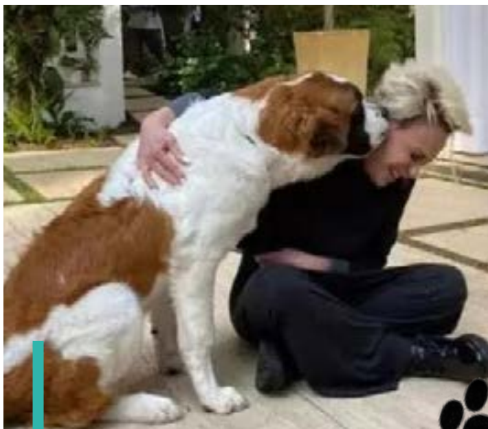
Ana Maria Braga recebendo um lambejo do seu Cappucino Braga!