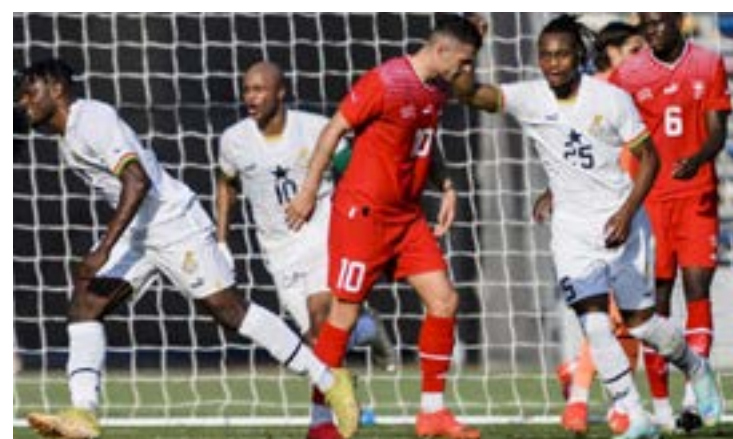
Suíça mostrou pouco futebol e perdeu por 2 a 0 para Gana

A seleção da Suíça, adversária do Brasil no Grupo G, perdeu o amistoso contra Gana, por 2 a 0, nesta quinta-feira (17). O time suíço deixou uma péssima impressão, mostrando deficiências em todos os setores, provando que o adversário mais forte da seleção brasileira na primeira fase será mesmo a Sérvia. O teste contra os sérvios será no jogo de estreia do Brasil, dia 24, às 16h (de Brasília), no Lusail Stadium. O técnico Tite treinou ontem em Turime deve entrar em campo com Alisson; Danilo, Thiago Silva, Marquinhos e Alex Sandro; Casemiro, Lucas Paquetá e Neymar; Raphinha, Vini Jr e Ri-