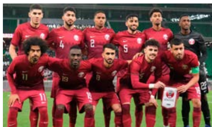
Seleção do Catar vai fazer o jogo de abertura no domingo, às 13h

O time do sheik é considerado o mais fraco do grupo, nos três últimos amistosos foram duas derrotas e um empate. Já o Equador chega ao Mundial como uma surpresa. A se-