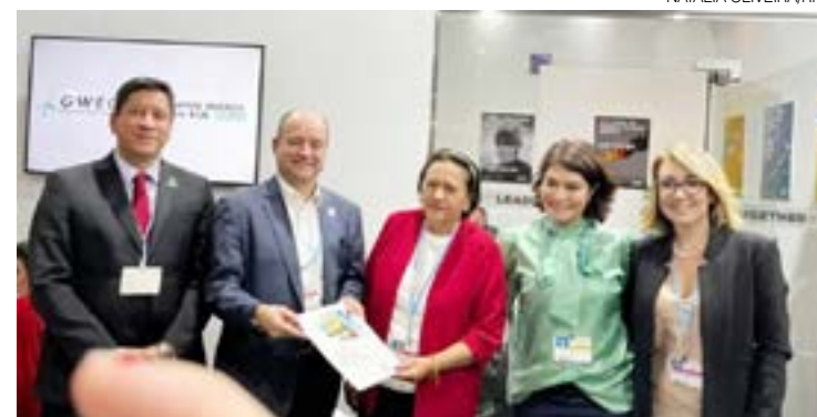
Fátima: "É o Rio Grande do Norte traçando caminhos sustentáveis"

"Apresentamos projetos e estudos, mostramos a liderança do Estado no setor de energias renováveis, o atlas solar e eólico, os estudos para o Porto Indústria Verde, que, inclusive, tem sugestão de localização e detalhamento para instalação de unidades de produção e confecção de insumos necessários à estrutura de geração de energia onshore e offshore e para produção de hidrogênio e amônia verde", disse Leon Aguiar.