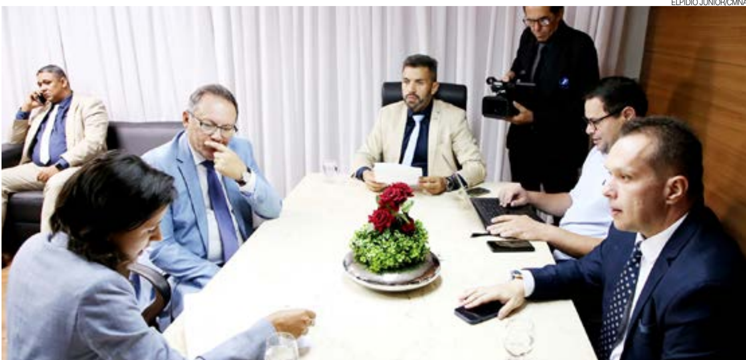
Vereadores integrantes da Comissão Especial se reuniram nesta quinta-feira para analisarem e aprovarem o relatório da Reforma da Previdência