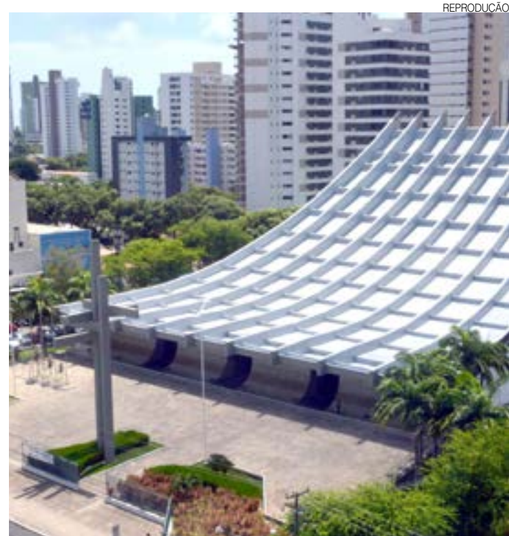
Catedral passará por revitalização e ganhará vitrais e painéis