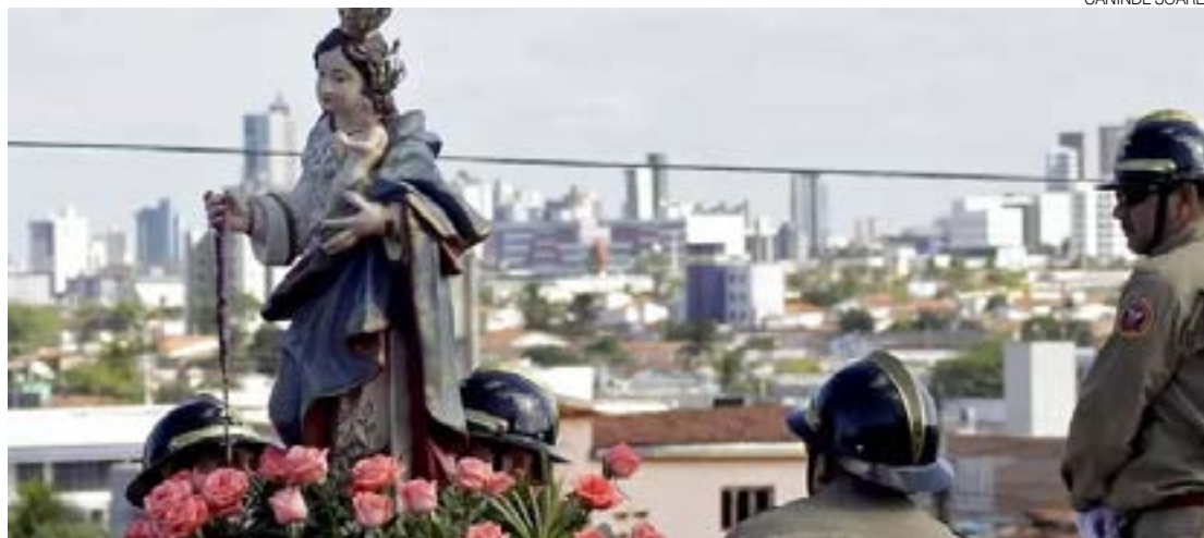
Serão 11 dias de festa com atividades variadas. Ponto alto acontece no dia 21, com intensa programação