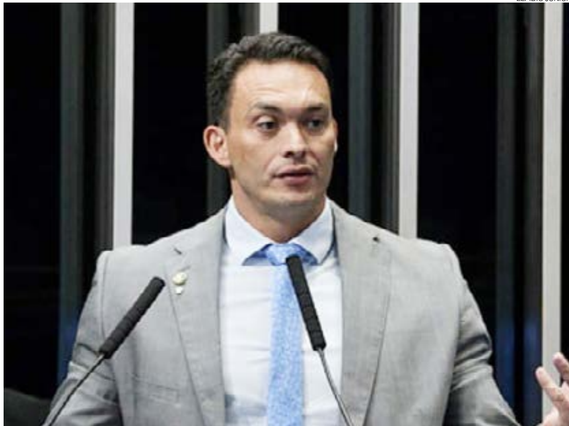
Styvenson: "Quem avalia se você está subvertendo, pedindo algo muito além do que diz a Constituição?"