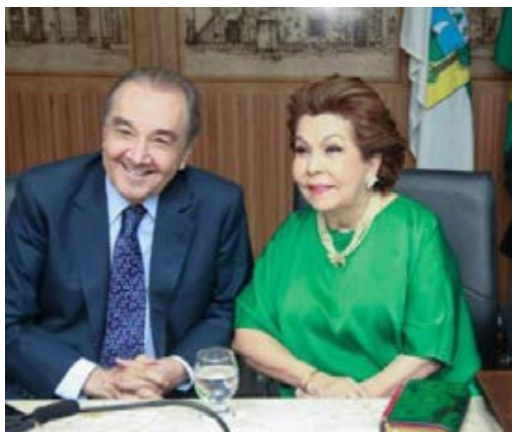
Com o es-senador José Agripino, um amigo de muitos anos da Família Gaspar