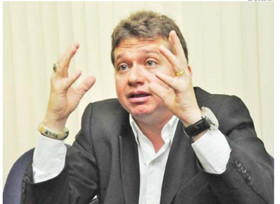
Herval: "Querem, baseado em fake news, contestar o resultado das urnas, faz com que os protestos sejam ilegais"