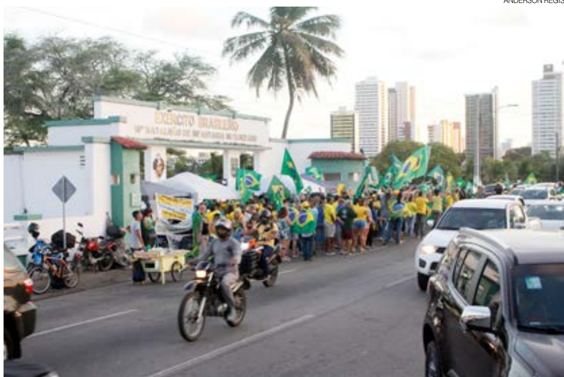
Extremistas se revezam em frente ao 16º RI, nos horários de pico, com banheiros químicos e barracas de apoio