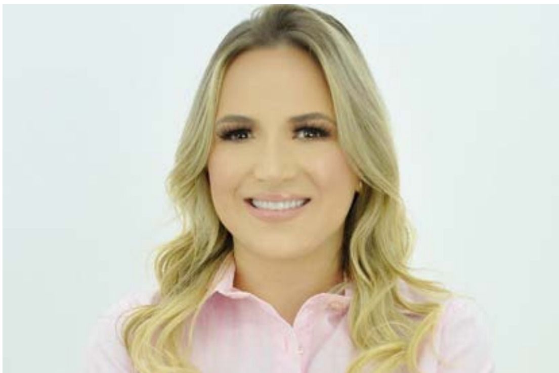
Mydia chegou a falar por meio de assessoria, mas não respondeu questionamentos feitos por jornalistas

Bem como o objetivo da viagem aos Estados Unidos, em que ela teria sido buscar outras possibilidades de desinfecção de água