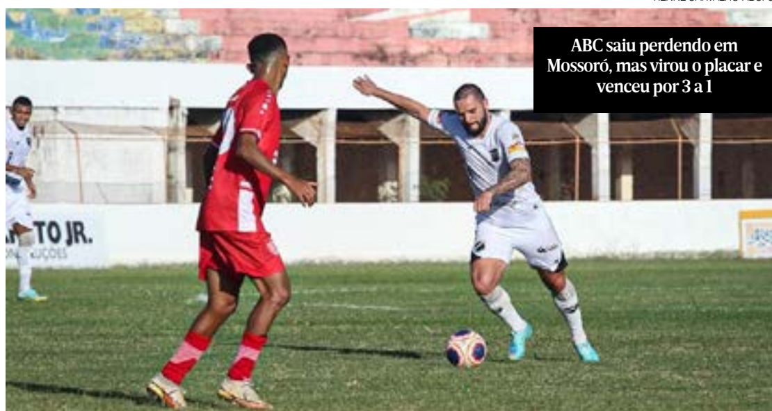
ABC saiu perdendo em Mossoró, mas virou o placar e venceu por 3 a 1