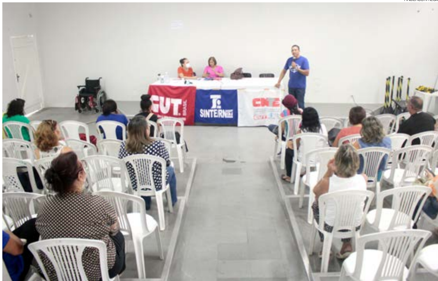
Professores afirmam que ação da Prefeitura Municipal de Natal descaracteriza o plano de carreira da categoria, e, por isso, seria ilegal

A Prefeitura do Natal, por sua vez, se manifestou através de nota, onde afirmou que professores e educadores infantis têm o direito aos 45 dias de férias, mas quando esses profissionais estão