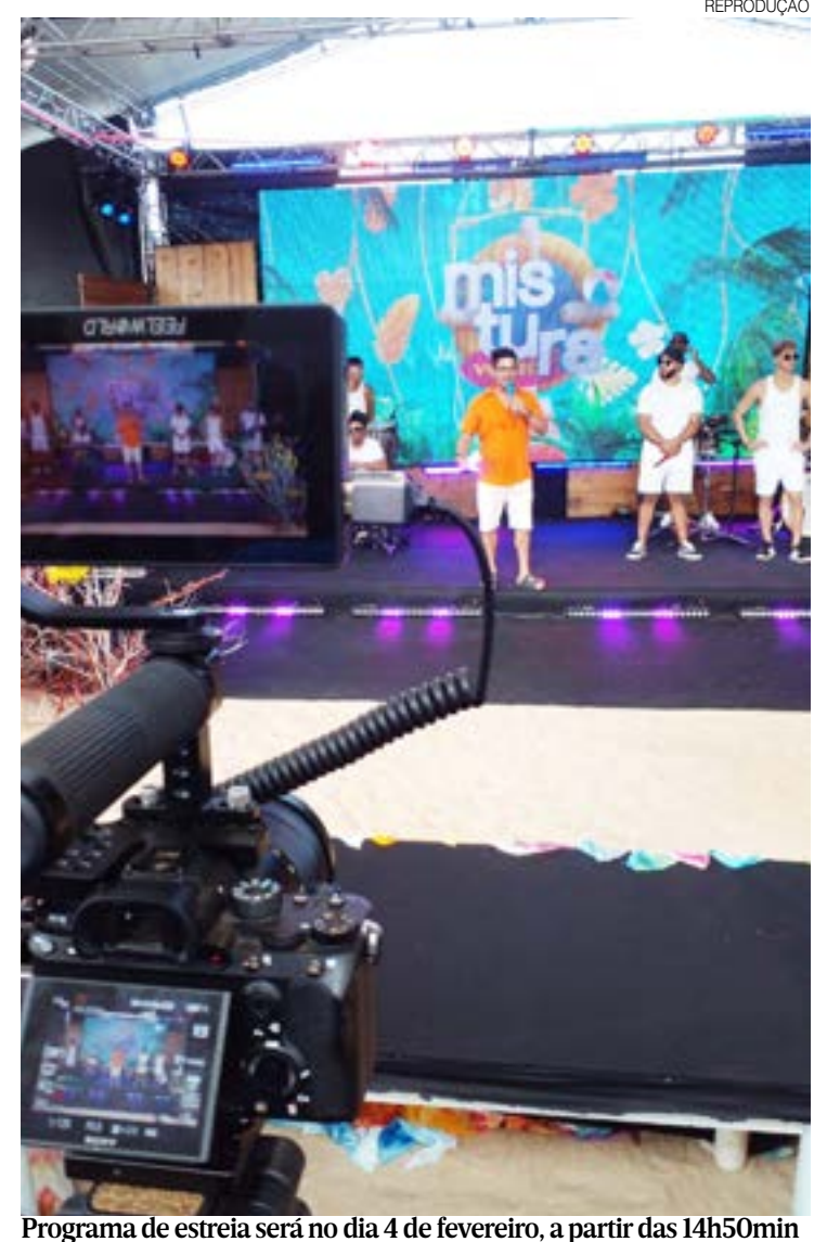
Programa de estreia será no dia 4 de fevereiro, a partir das 14h50min