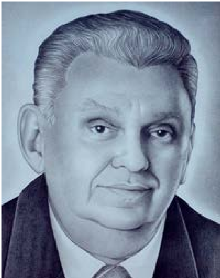
Agnelo Alves, prefeito de 2000 a 2008, nasceu em Ceará-Mirim