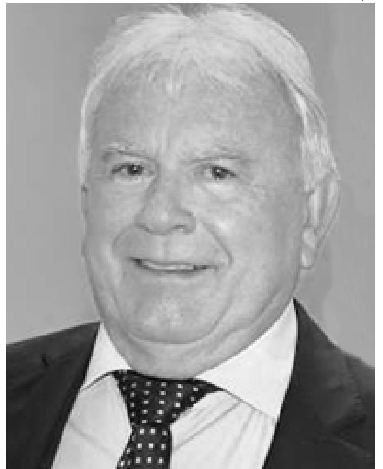
Maurício Marques, prefeito de 2009 a 2017, é natural de São Mamede (PB)