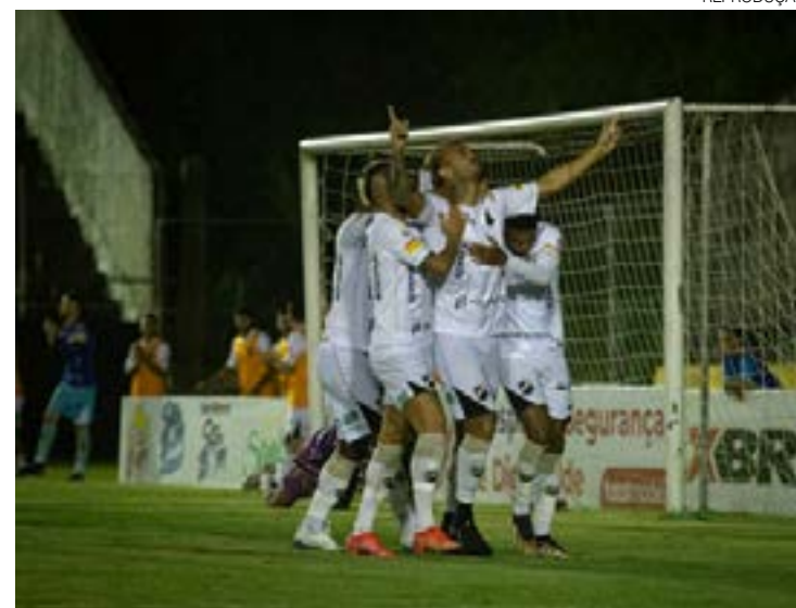
Time alvinegro vai enfrentar o Potiguar de Mossoró no Frasqueirão