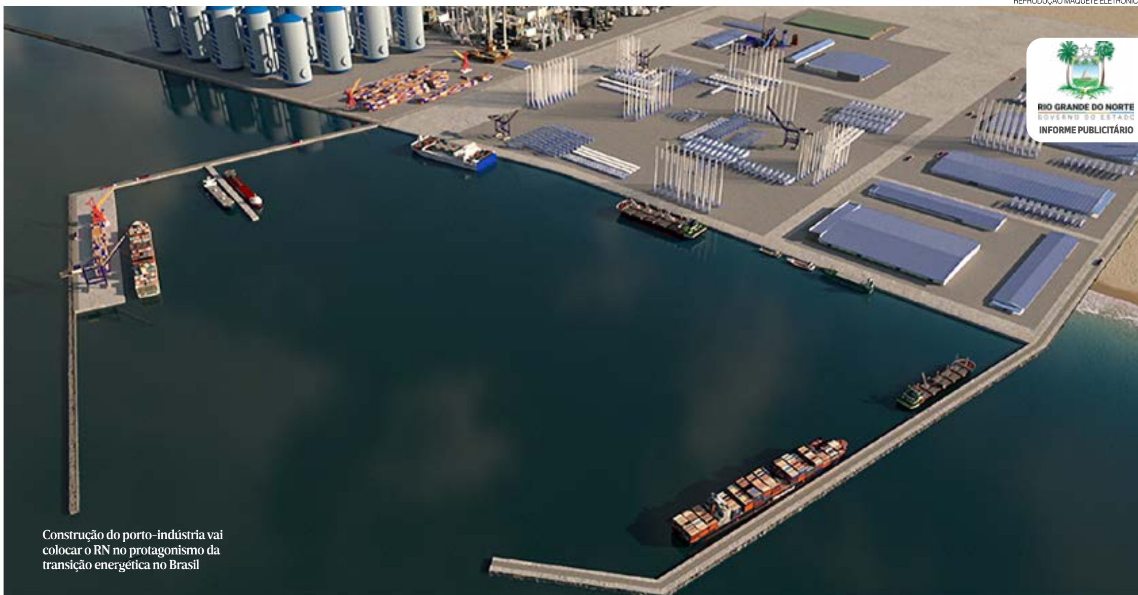
Construção do porto-indústria vai colocar o RN no protagonismo da transição energética no Brasil