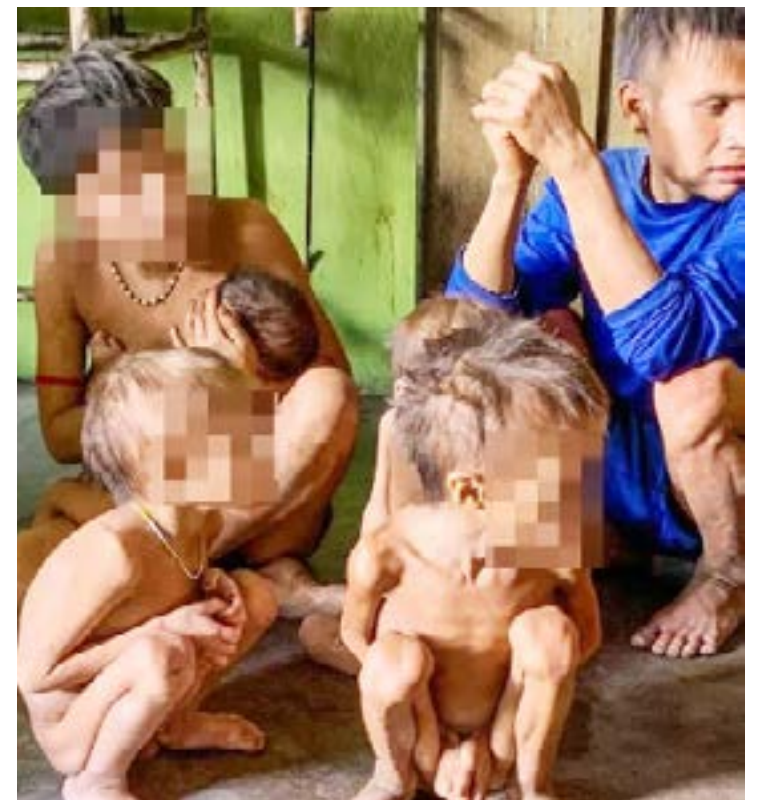
Imagens de indígenas com fome chocaram o mundo no fim de semana

rio brasileiro no âmbito do mecanismo de revisão periódica universal do Conselho de Direitos Humanos”. Para esta viagem, ela recebeu pouco mais de R$ 31 mil em diárias.