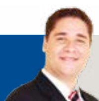
Empresários apresentam planilha para justificar reajuste

Assinam o ofício encaminhado à STTU, além das Transcoop, os representantes das seguintes entidades: Seturn, CBTU/STU-NAT, Sindicato dos Taxistas, Sindmoto/RN, Sintro/RN, Câmara Municipal de Natal, DNIT, Sindicato dos Trabalhadores Autônomos, Conselho Municipal dos Direitos da Pessoa Idosa, Coopten, Detran, ACIRN, Fecomércio e DER/RN.