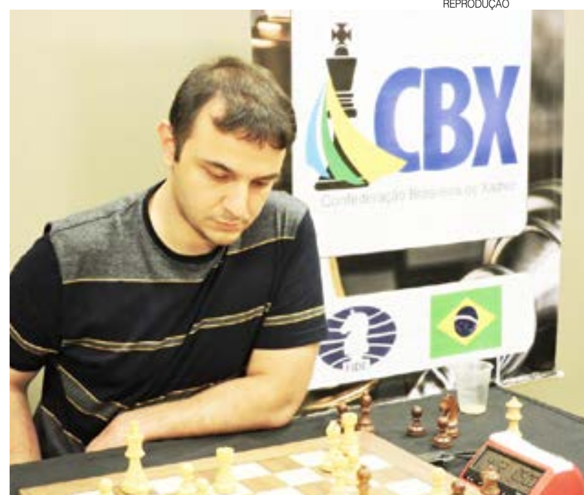
Evento de xadrez será realizado de 18 a 20 de fevereiro na capital

A 13ª edição do Aberto do Brasil Xadrez Potiguar vai distribuir R$6.000,00 (seis mil reais) em premiação e vai contar como a quinta etapa do Circuito Nacional de Abertos do Brasil 2023, além de valer vaga para as finais do Campeonato Brasileiro Absoluto e Feminino. As inscrições estão abertas e podem ser feitas pelo site www.xadrezpotiguar.com.br .