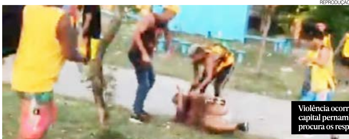
Violência ocorreu pelas ruas da capital pernambucana. PM ainda procura os responsáveis