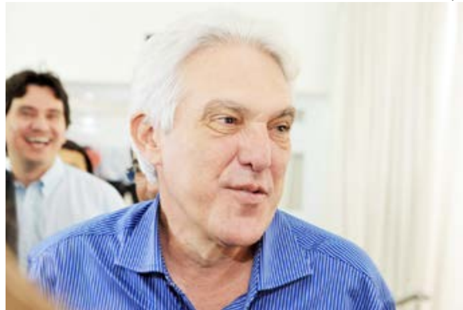
João Maia indicou dentista para órgão do Ministério da Saúde no RN e não em Brasília

Entre os dias 7 e 10 de dezembro passado, Midya esteve presente no Distrito Sanitário Especial Indígena Yanomami (DSEI), no norte do país. No detalhamento da viagem, ela declarou que foi para “apoiar a coordenação do DSEI na promoção de estudo diagnóstico e proposição de ações destinadas à resolução de questões afins à saúde dos povos indígenas”. Com uma remuneração mensal de pouco mais de R$ 13,6 mil, ela recebeu quase R$ 7,5 mil em diárias operacionais para a viagem, que deveria, conforme ela mesma disse, ter feito um diagnóstico da situação no local. Esta só ficou conhecida nacionalmente neste último fim de semana, quando o presidente Lula (PT) viajou para Roraima para acompanhar os trabalhos dos ministérios da Saúde e dos Povos Indígenas na Terra Indígena Yanomami, após a Saúde ter declarado emergência de saúde pública por falta de assistência sanitária, na última sexta-feira (20). Foi justamente ao longo do período em que Midya esteve no cargo que transcorreram as negligências. Calcula-se que, em quatro anos, 570 crianças da comunidade morreram por desnutrição, além de outras doenças evitáveis.