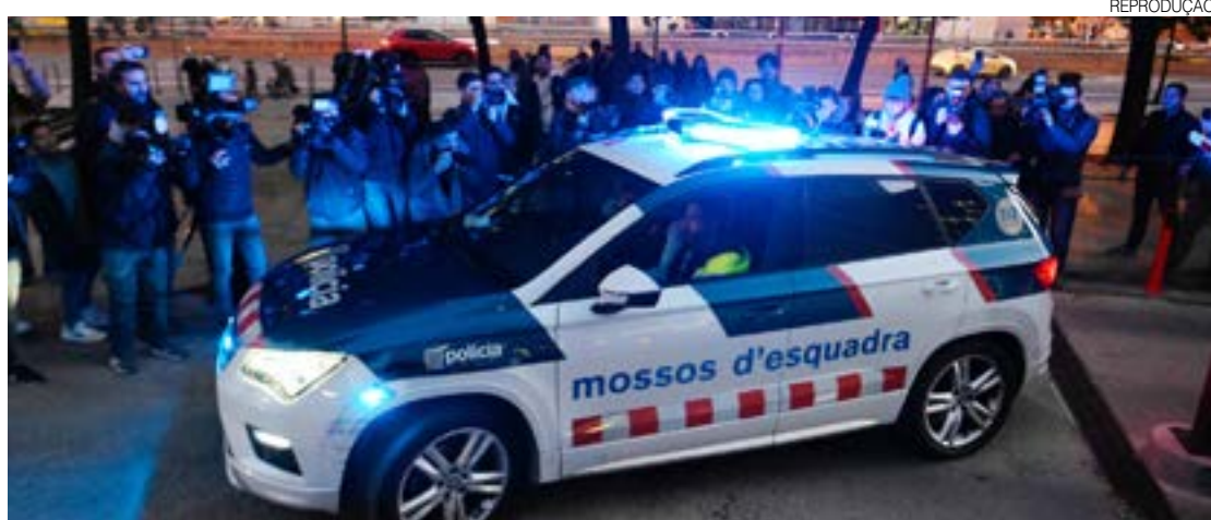
Ex-atleta do Barcelona e Seleção Brasileira cumpre prisão preventiva por estupro e agressão sexual

que Daniel ficará em uma cela individual com banheiro e que sua transferência é para evitar a exposição, pois é um jogador muito famoso na região, o que poderia trazer riscos para a sua segurança.