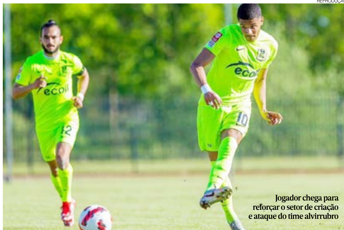
Jogador chega para reforçar o setor de criação e ataque do time alvirrubro