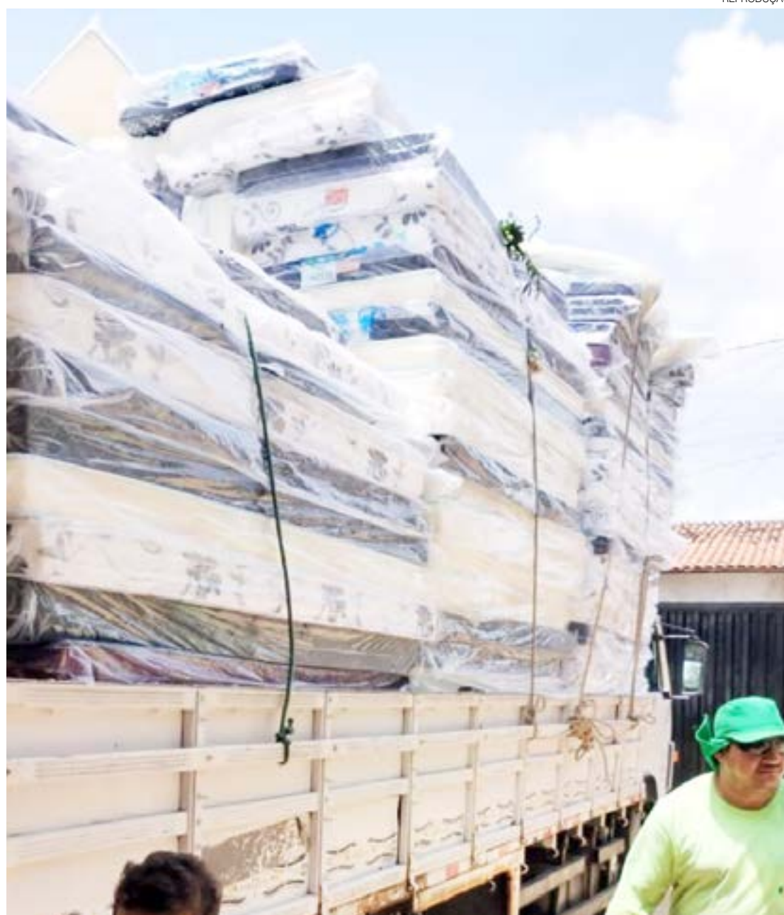
Kits entregues continuam dois colchões, duas cestas básicas e kits de higiene pessoal e de limpeza

“É um absurdo que a assistência do nosso município possa estar sendo usada como moeda eleitoral. Temos relatos de serviços da Assistência em Natal que desde julho não recebem uma única cesta básica para entrega e agora, aparecem inúmeros kits com o carimbo do governo federal. Onde estavam esses kits nos momentos de maiores chuvas?”, questionou.