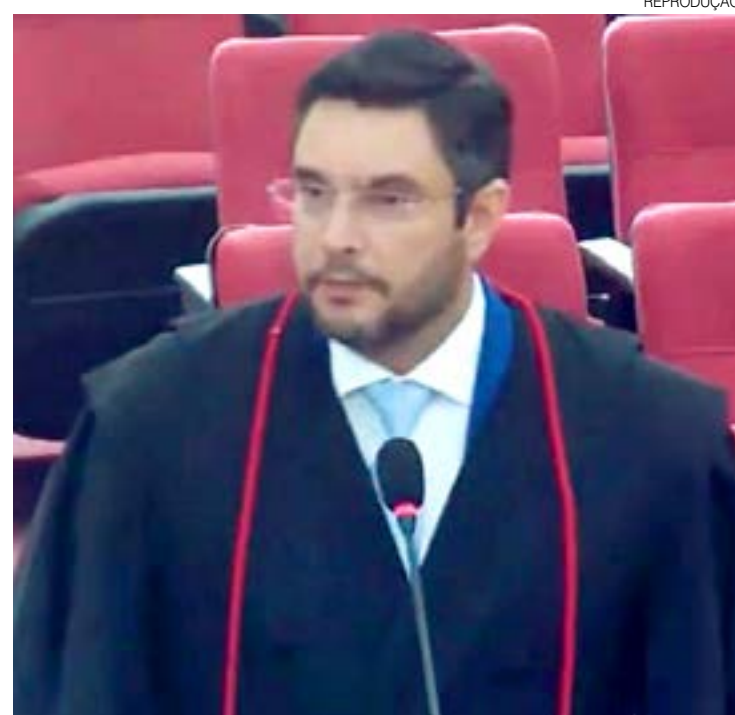
Donnie: “Pode atrair insegurança jurídica a 7 dias para a eleição”

Acho válido esse tipo de proposição para o próximo pleito, com lei em sentido estrito aprovada pelo Congresso