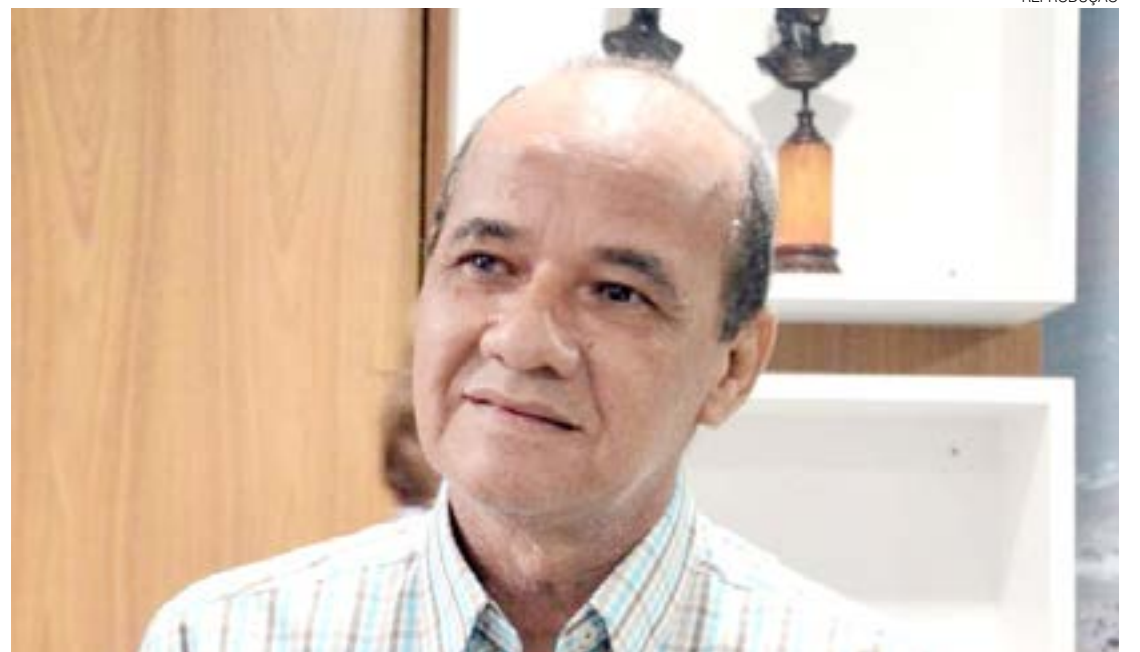
Entre tarifas reajustadas por Taveira, estão a 2ª via de licença sanitária e aditivo para contrato social

Reajuste será de 7,79% e atingirá 35 taxas referentes à serviços e autorizações