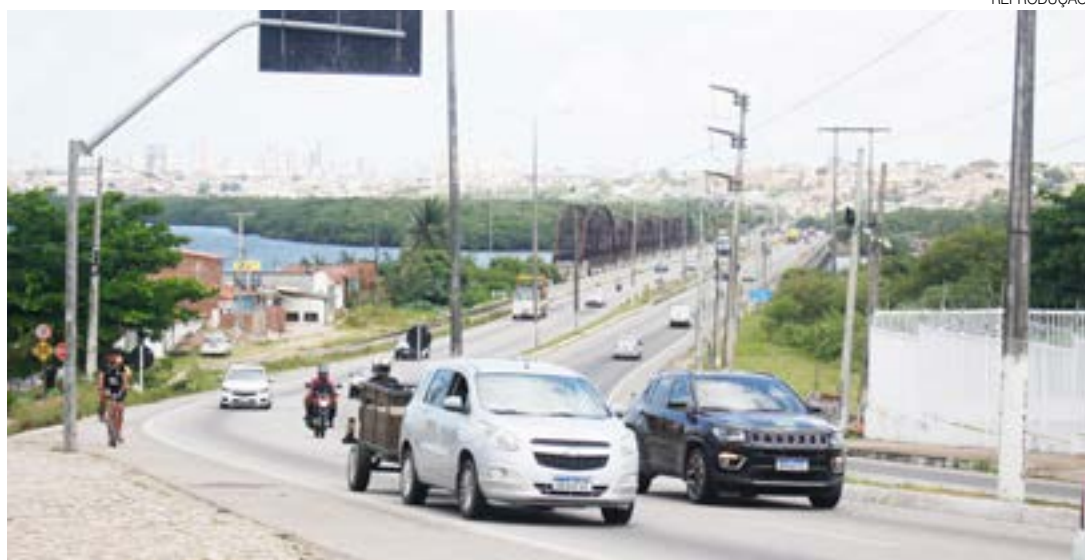
Interdição acontecerá na faixa da direita, sentido Urbana, permanecendo as demais em operação