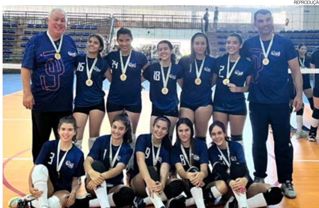
Equipe de vôlei feminino do Ceil Romualdo vai representar o Rio Grande do Norte nos Jogos Brasileiros