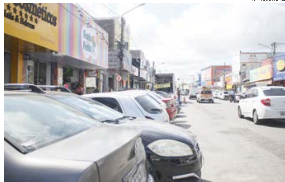
Falta de vagas e de estacionamentos rotativos é crônico e lojistas pedem apoio da Prefeitura

A falta de estacionamentos preocupa comerciantes e lojistas do bairro, que temem perder os consumidores em função do movimento. De acordo com uma pesquisa realizada pelos Ecossistemas de Competitividade e Inovação em Comércio e Serviços (ECICS - Sistema Comércio), 80% dos empresários