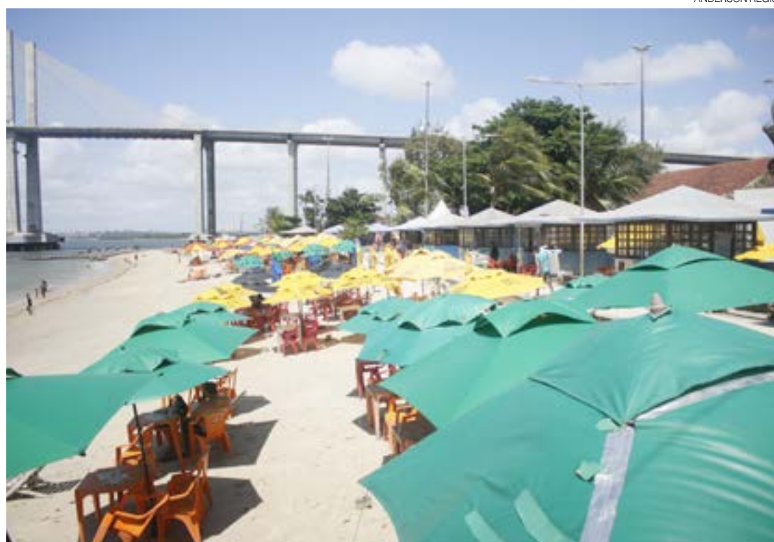
Praia e sol ainda estão entre os principais atrativos para o turista de outras regiões do Brasil e do exterior