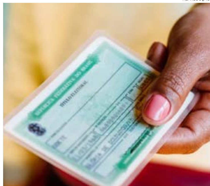
Para denúncia, crime de assédio precisa de comprovação ou testemunhas

Entre os vários crimes relacionados às eleições 2022, um tipo vem se destacando: o assédio eleitoral, prática que é mais comum do que se pensa. Para o procurador chefe da Procuradoria Regional do Trabalho em Natal (21ª PRT), Luiz Fabiano, os casos de assédio eleitoral preocupam. "Apesar de o RN ainda não apresentar os números de outras regiões, existe uma tendência de crescimento. O enfrentamento dessas ilicitudes é um desafio importante, sobretudo em vista da iminência do segundo turno das eleições presidenciais", disse.