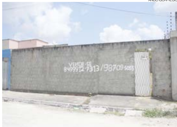
Local onde deveria funcionar a locadora, é um terreno murado

endereço alegado seria a Rua José Roseno Pereira, 155, no Parque dos Ipês, em São Gonçalo do Amarante. Tudo conforme se en-