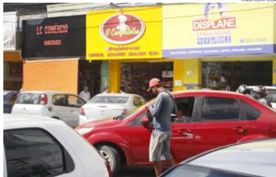
Transitar no Alecrim é sinônimo de dor de cabeça e gasto extra de combustível

são os dias mais movimentados. Assim, os estacionamentos do bairro viram uma verdadeira dança das cadeiras: “No sábado, nós temos a Feira do Alecrim. Nesse dia, os feirantes estacionam na vaga dos clientes, os lojistas estacionam na vaga dos clientes. Quando os clientes chegam, não há mais vagas”, disse. Ainda segundo Matheus, a média de preços dos estacionamentos particulares (existem cerca de 20 no Alecrim) variam entre seis e oito reais por hora.