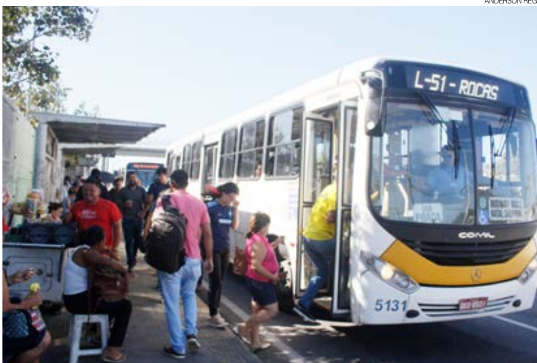
Potiguares poderão se deslocar para exercer seu direito ao voto sem a necessidade de pagar a tarifa de ônibus

O Supremo Tribunal Federal (STF) liberou prefeituras e empresas concessionárias para